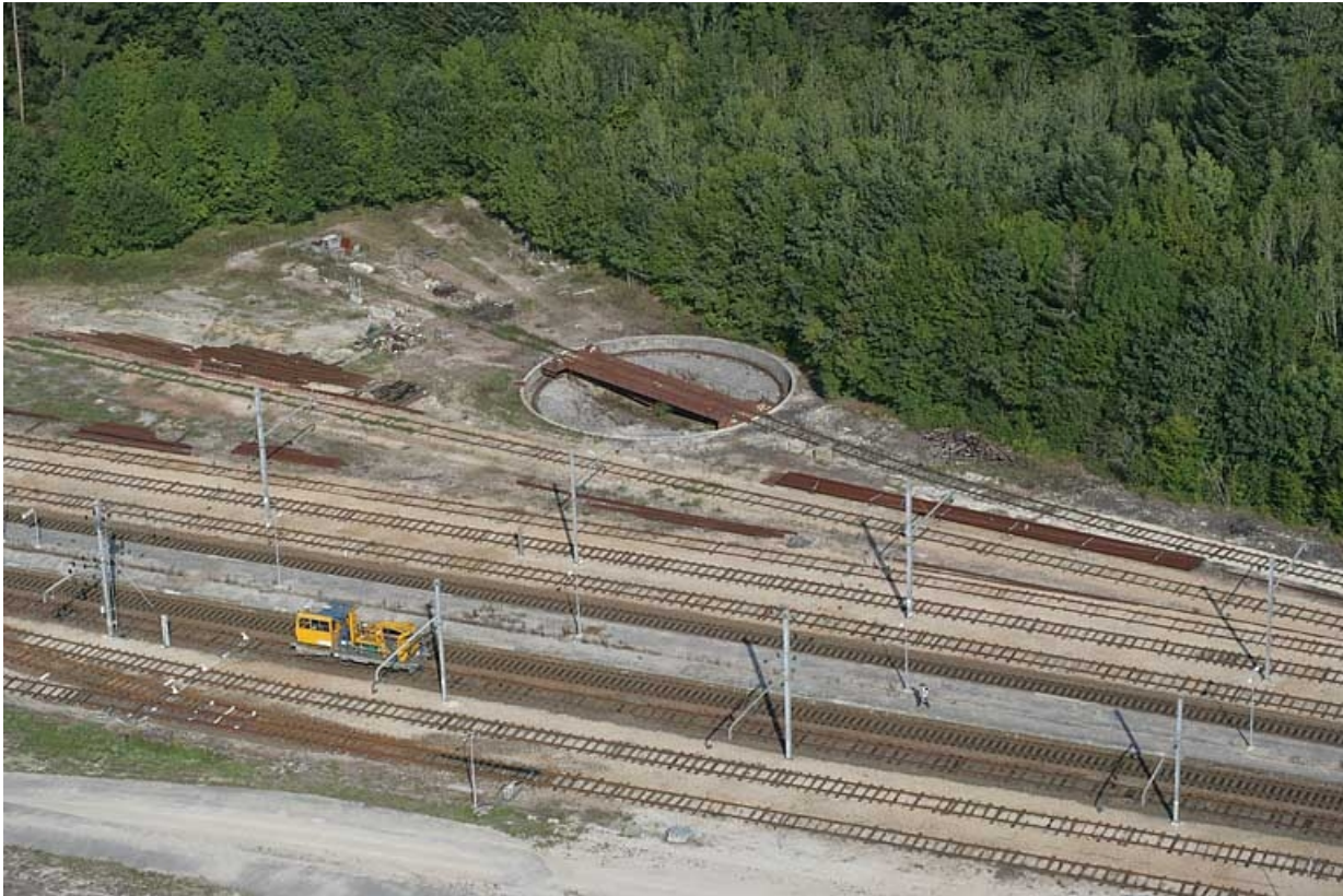
Vue aérienne, depuis l'est.

39, Andelot-en-Montagne, 44, 46 rue de la Gare