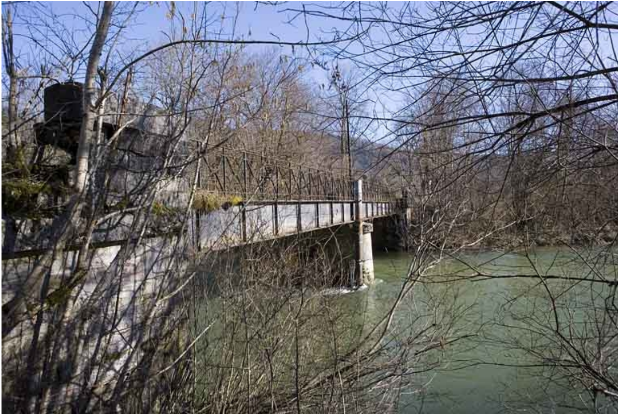
Vue en enfilade, depuis la rive gauche en amont.

39, Syam chemin de la Gare, lieudit : les Forges