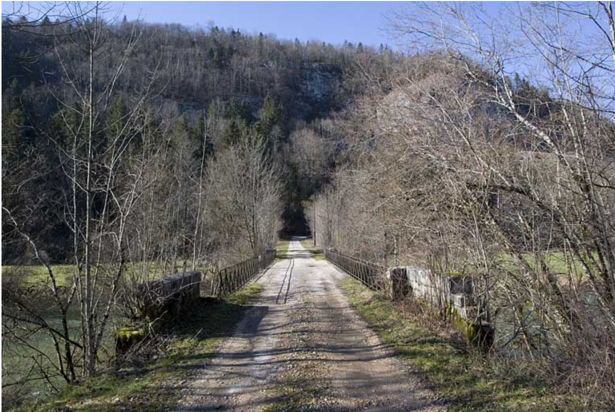
Vue d'ensemble du pont et du chemin de la Gare.

39, Syam chemin de la Gare, lieudit : les Forges