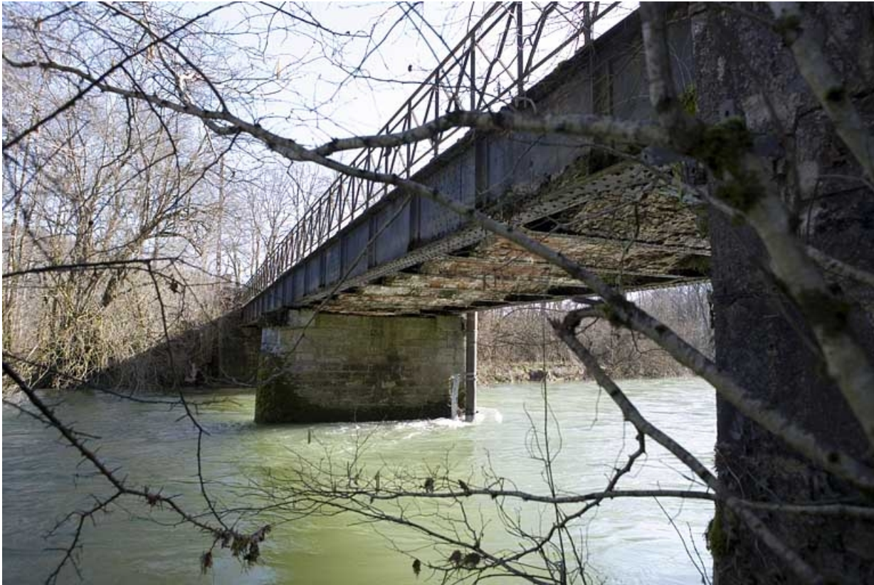
Vue en enfilade, depuis la rive gauche en aval.

39, Syam chemin de la Gare, lieudit : les Forges