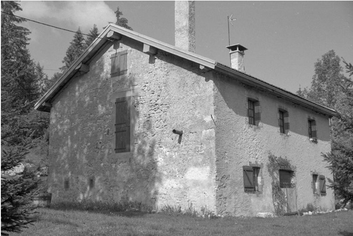
Vue générale de la fromagerie de la Combe Servagnat, à Longchaumois.