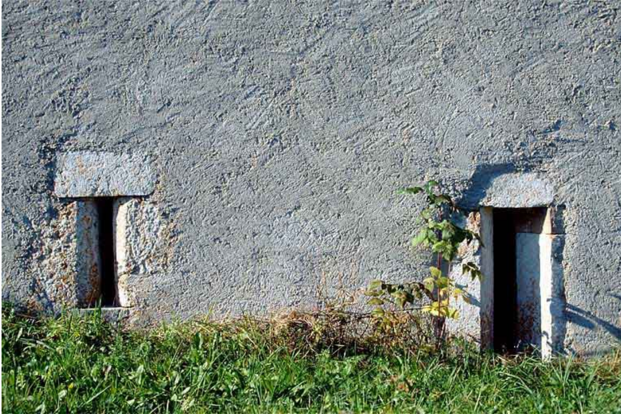
Baies fromagères de la fromagerie des Raisses, à Longchaumois.