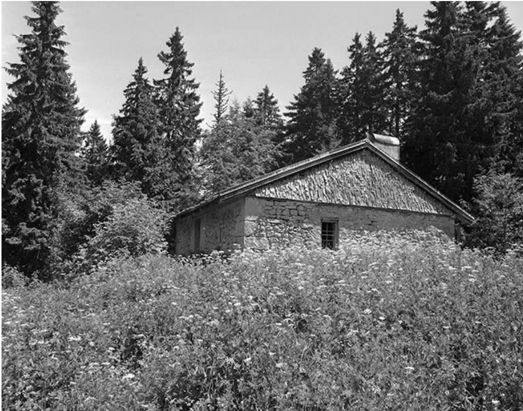
Façade postérieure et face gauche.