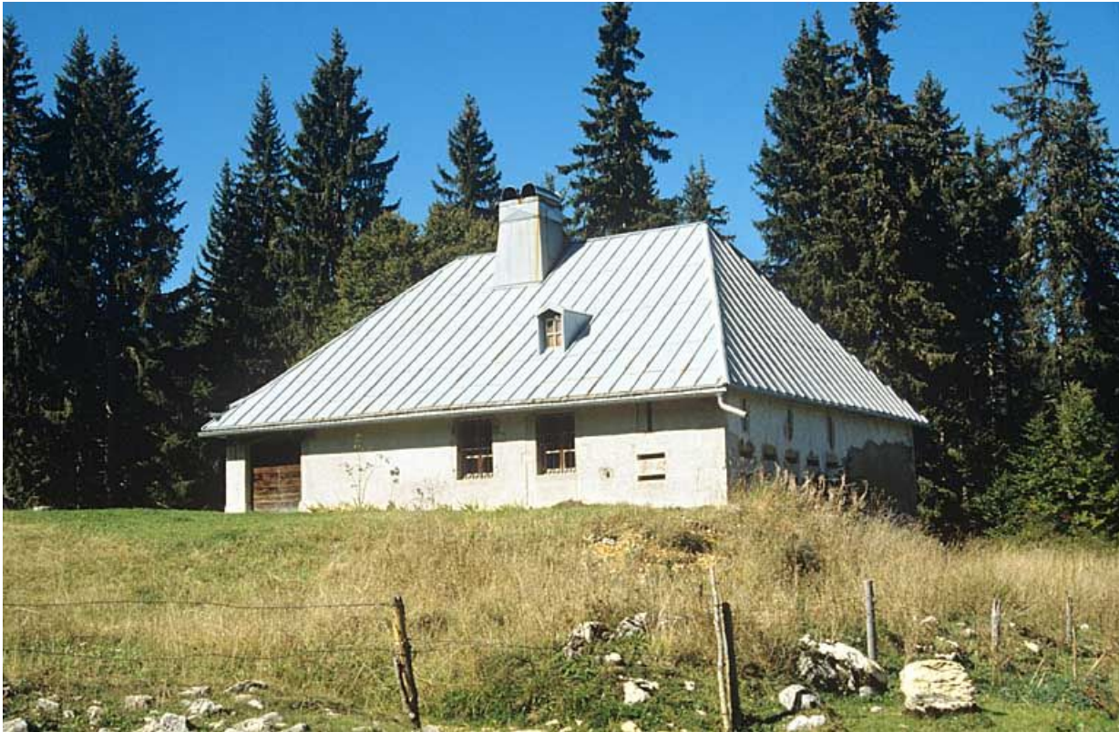
Vue générale de la façade antérieure du chalet d'estive du Petit Boulu.