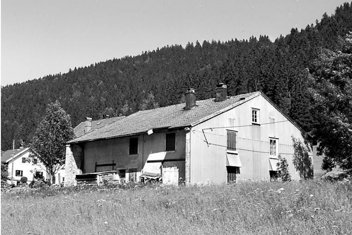
Façade antérieure et face droite.