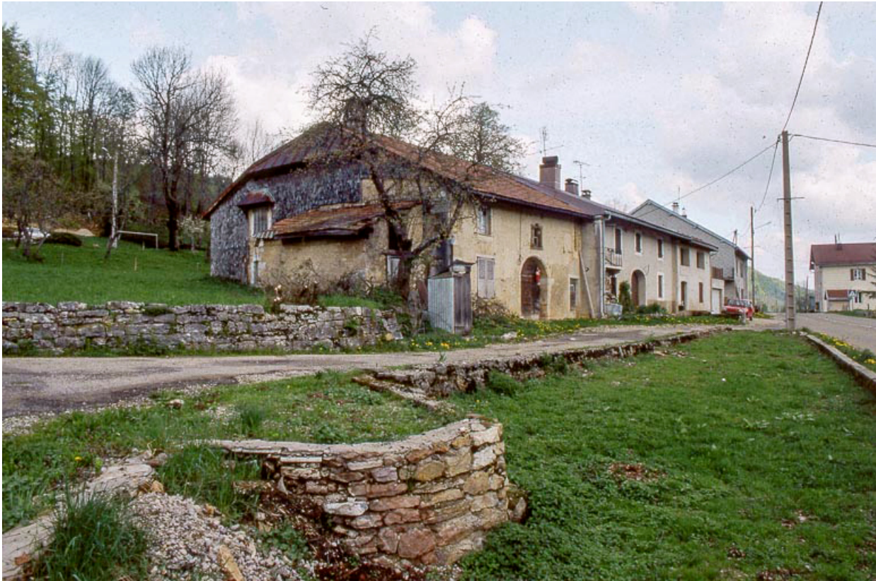
Fermes du village bordant le C.D. 26.