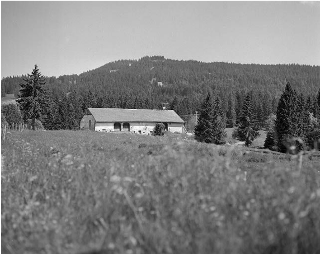
Vue éloignée de la façade postérieure.

39, Prémanton, 1122 route des Pessettes, lieudit : la Joux dessus