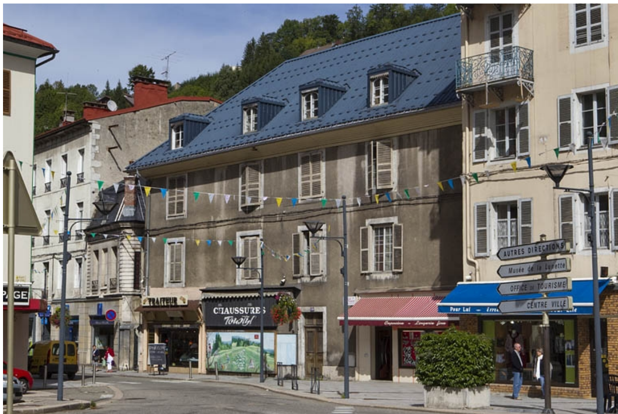
Elévation antérieure, de trois quarts droite.