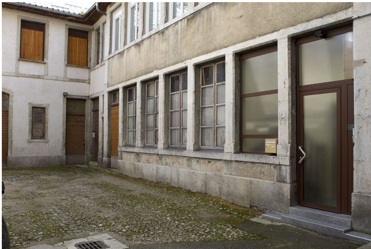
Immeuble (157 rue de la République) : atelier (à baies multiples) dans la cour. 39, Morez, 157 rue de la République