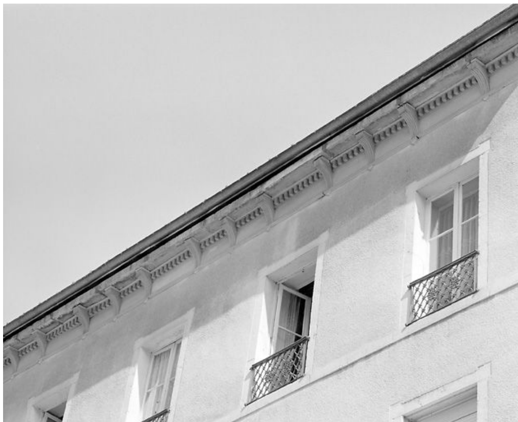
Façade antérieure : corniche.