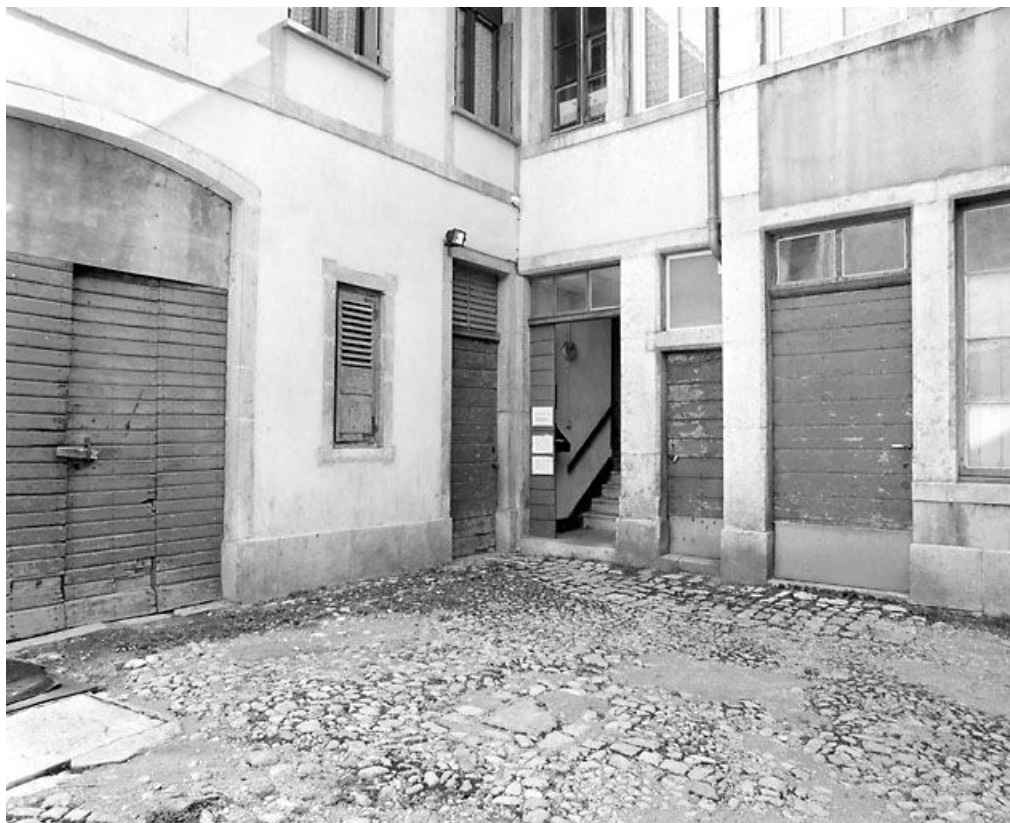
Angle de la remise et de l'atelier.