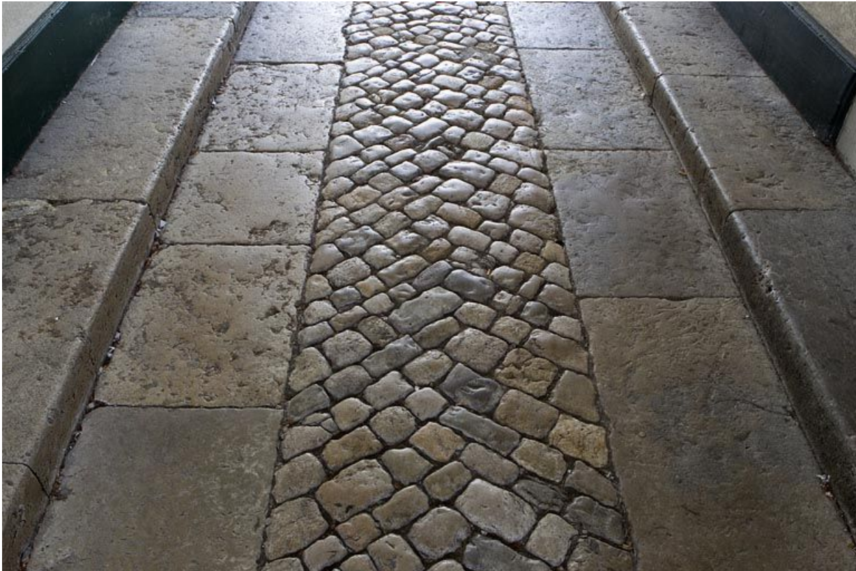
Passage couvert : sol de galets.