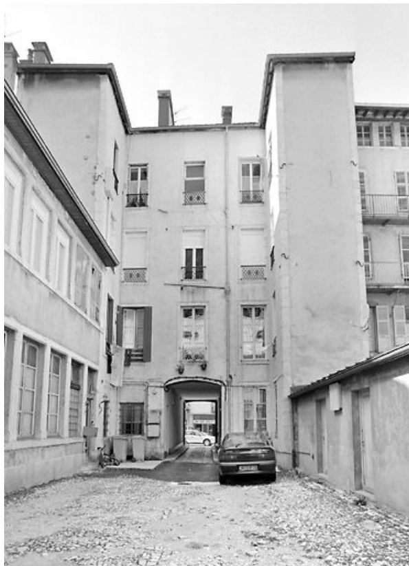
Façade postérieure et cour.