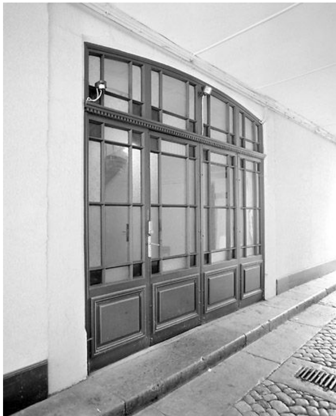
Passage couvert : porte de l'escalier.