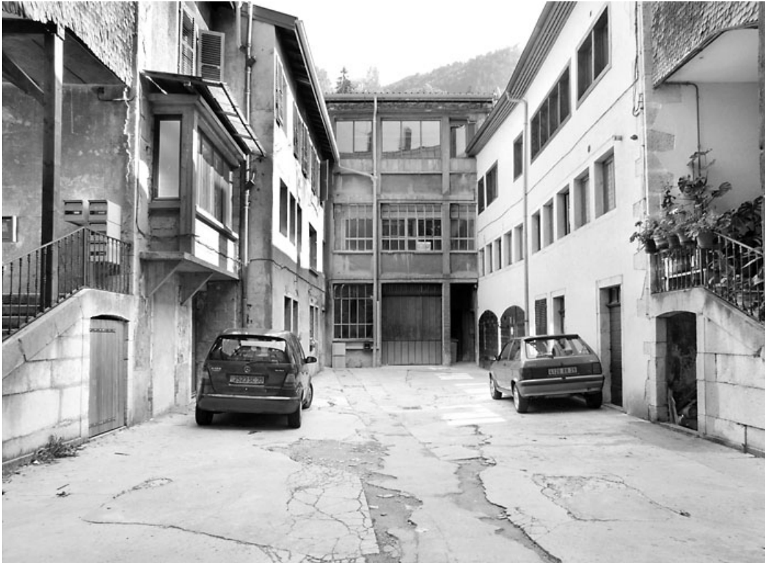
Vue d'ensemble des bâtiments dans la cour.