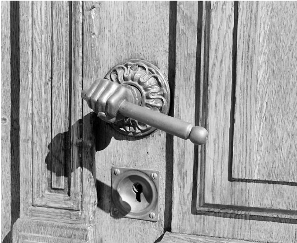
Porte principale : poignée en forme de main.