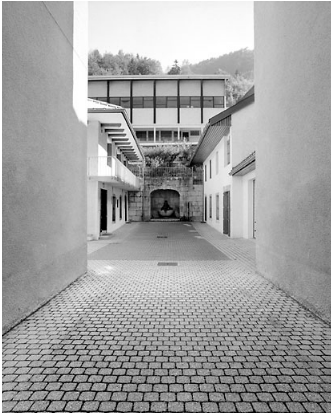
Vue d'ensemble de la cour et des anciennes dépendances.