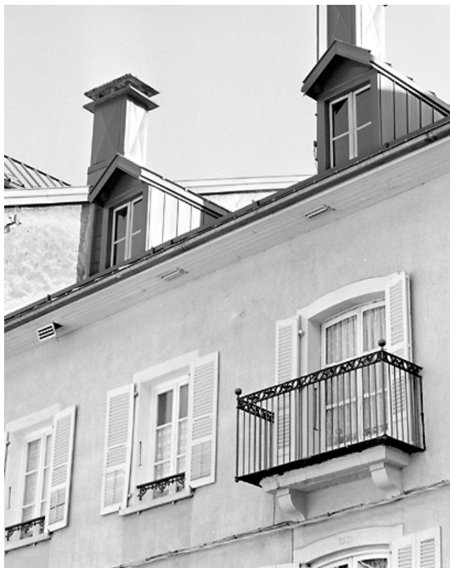
Fenêtres et balcon du deuxième étage.