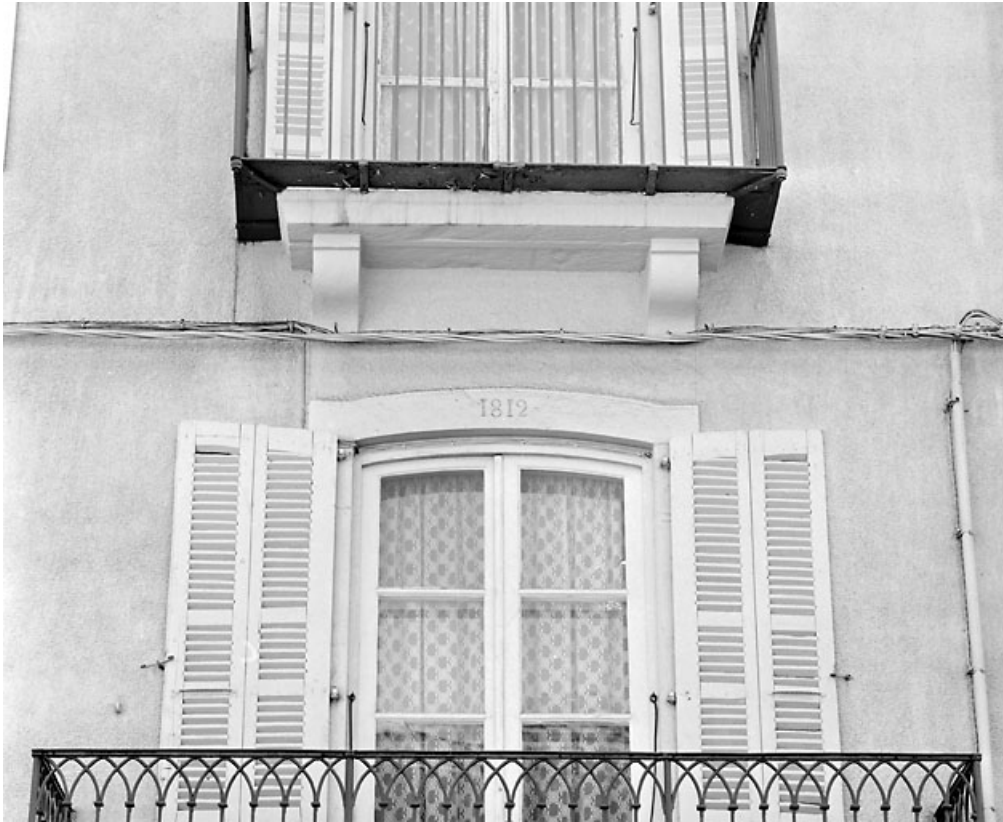
Linteau daté de la porte-fenêtre du premier étage.