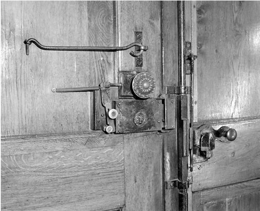
Porte principale : serrure et fermeture intérieure.