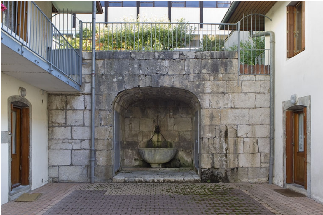
Mur de soutènement, niche et fontaine.