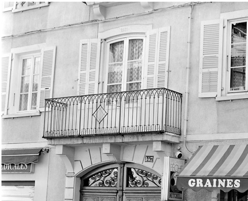
Porte-fenêtre et balcon du premier étage.