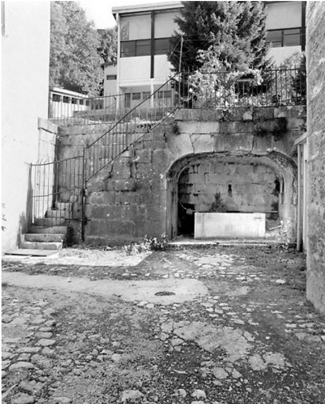
Immeuble (19e siècle) au n° 145 rue de la République : fontaine, escalier isolé et mur de soutènement. Immeuble (AI 69). 39, Morez, 145 rue de la République