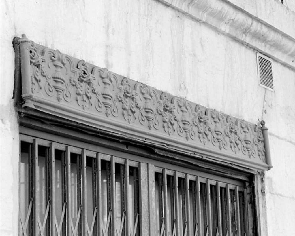
Façade latérale gauche : décor en tôle estampée.