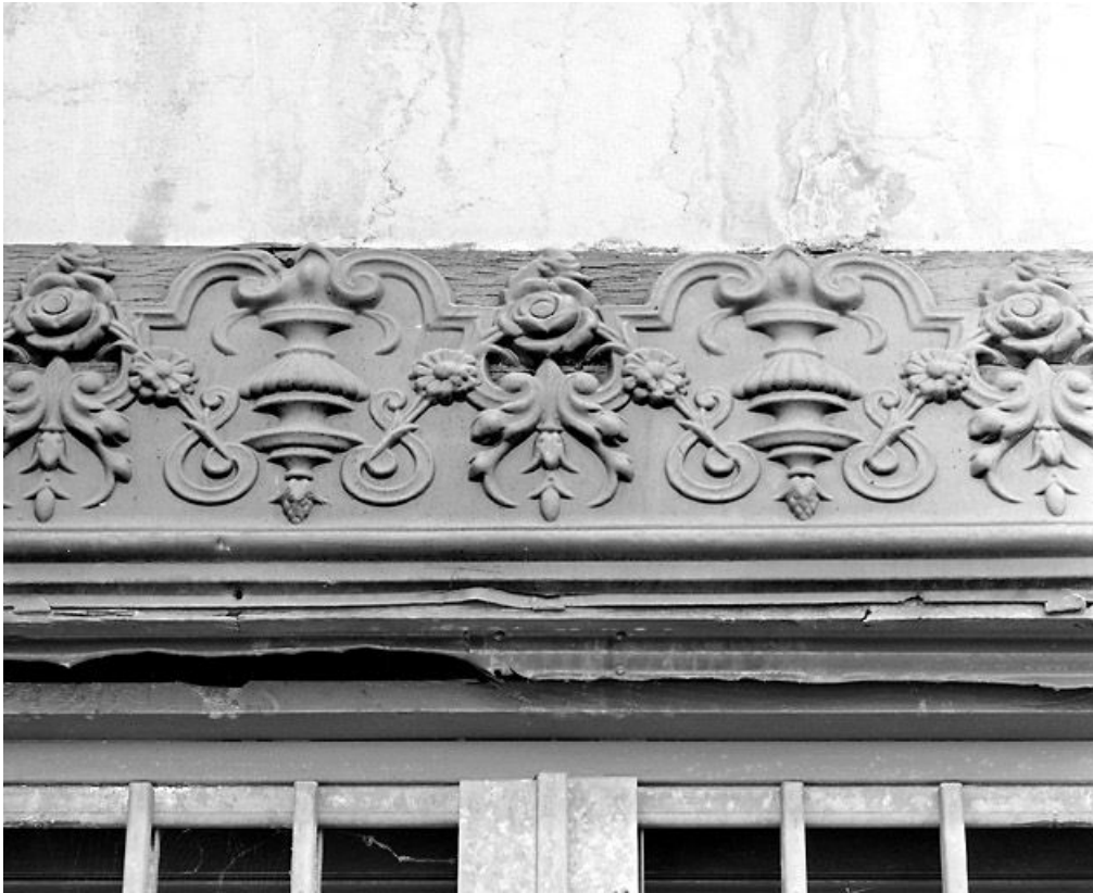
Façade latérale gauche : détail du décor.