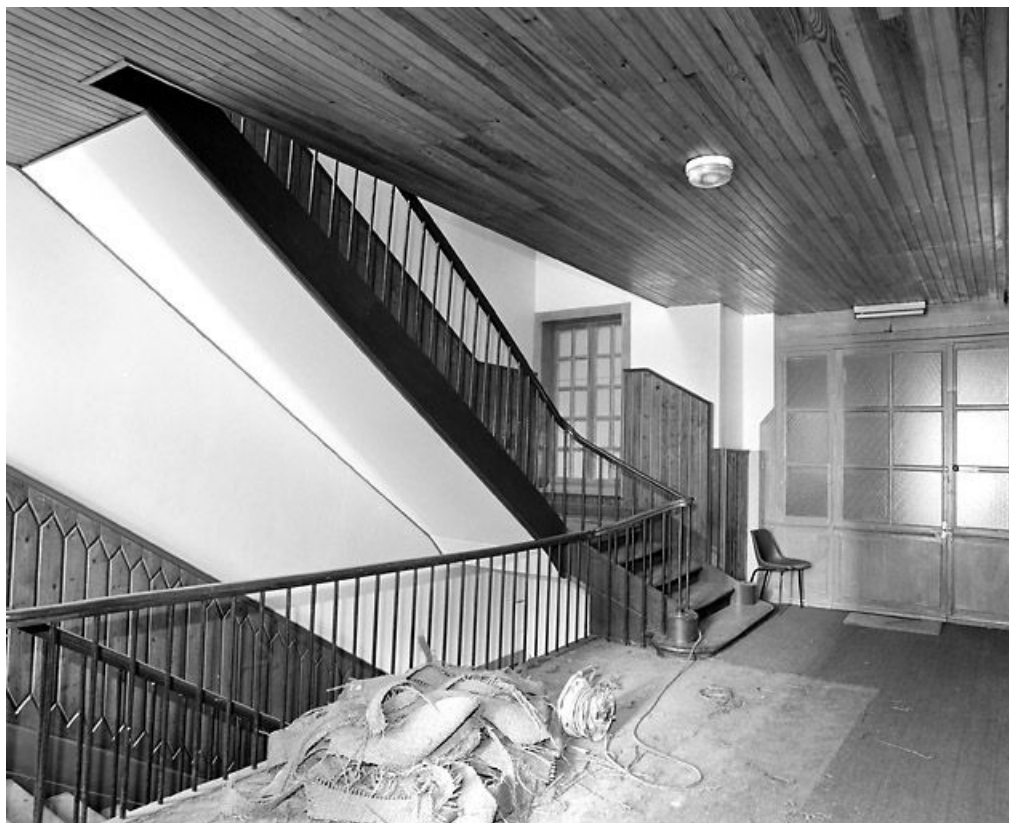
Escalier : un palier.