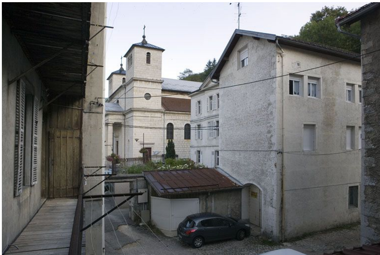
Bâtiment nord et cour.