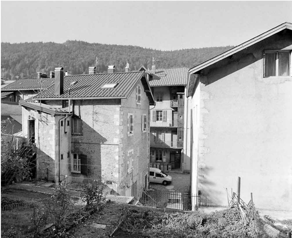
Vue d'ensemble depuis le jardin (à l'est).