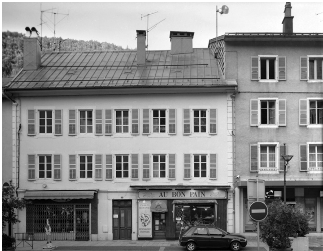
Vue d'ensemble rue de la République.