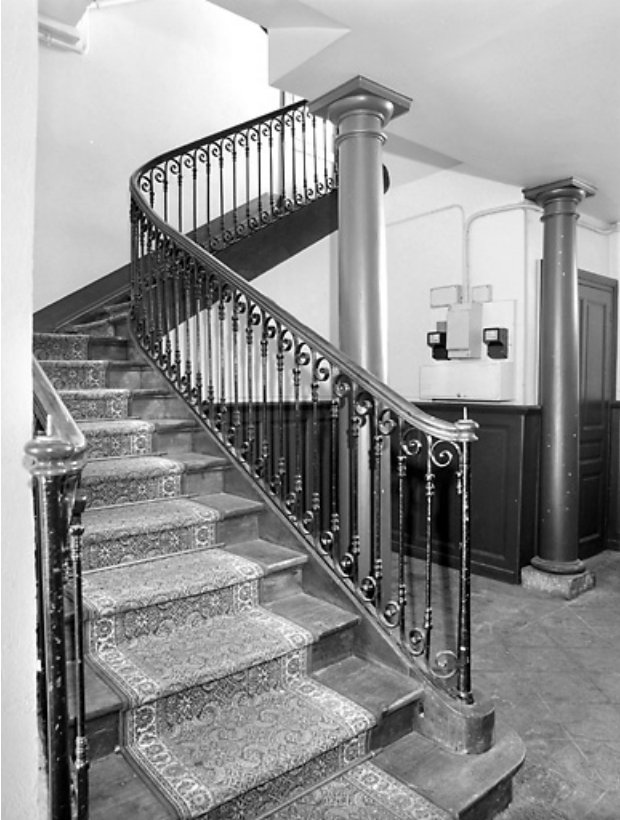
Départ de l'escalier et colonnes.