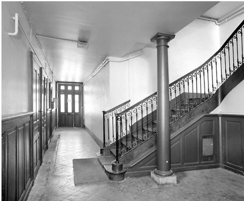
Couloir et escalier tournant.