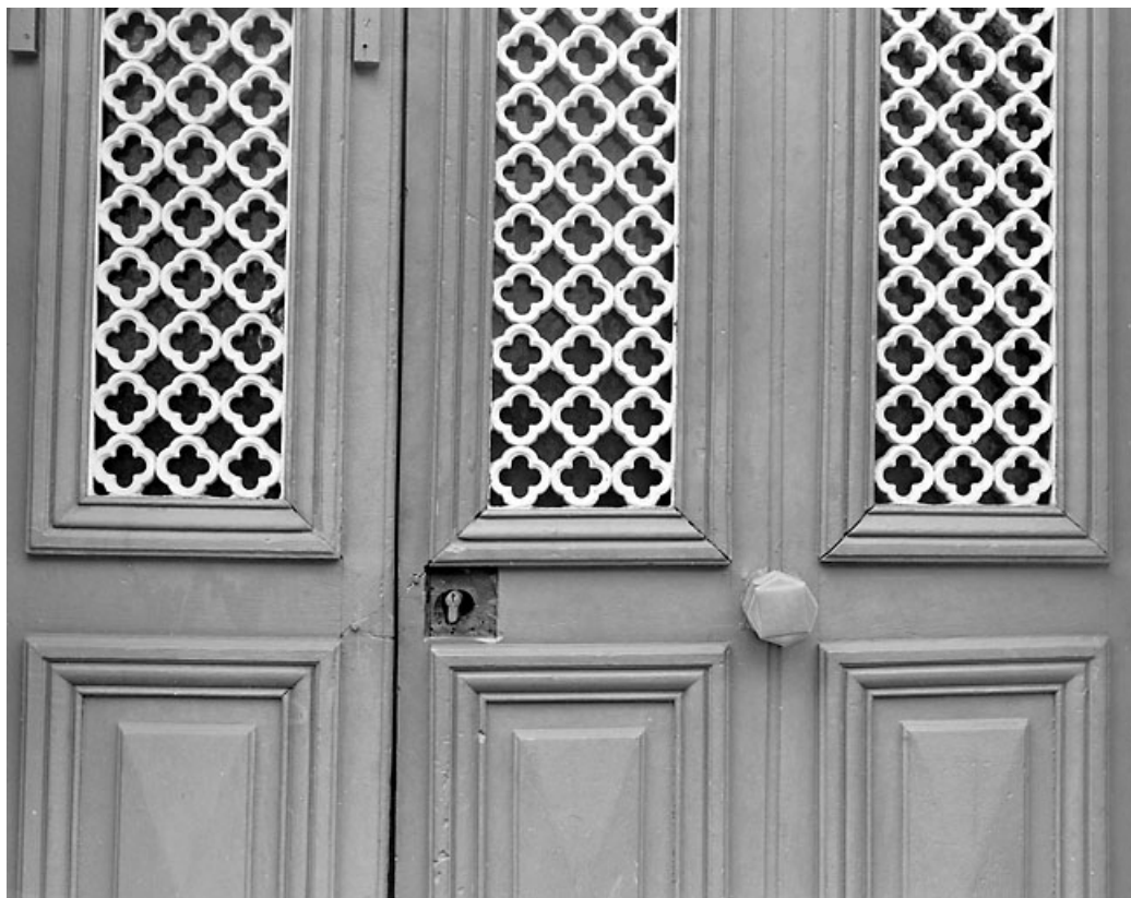
Porte principale : détail.