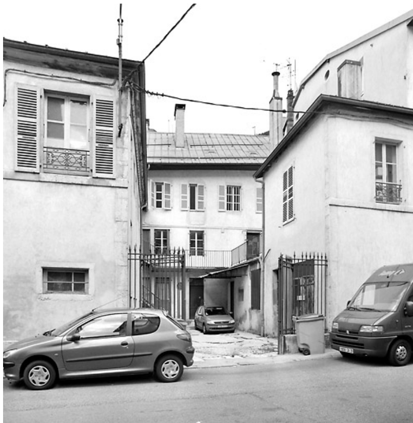
Vue d'ensemble rue des Promenades.