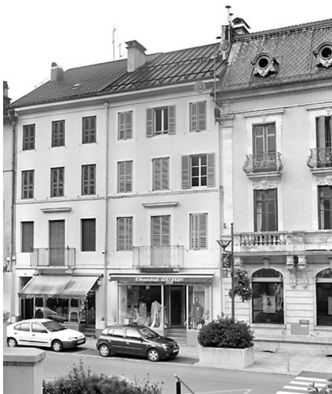
Elévation antérieure, de trois quarts droite.

39, Morez, 124, 126 rue de la République