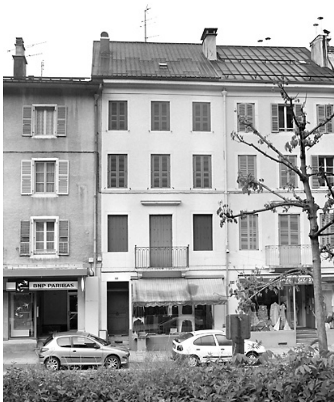
Élévation antérieure du n° 126.

39, Morez, 124, 126 rue de la République