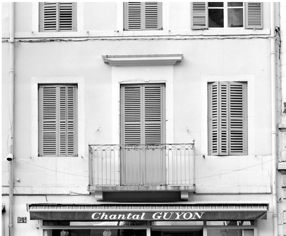
Premier étage du n° 124.

39, Morez, 124, 126 rue de la République