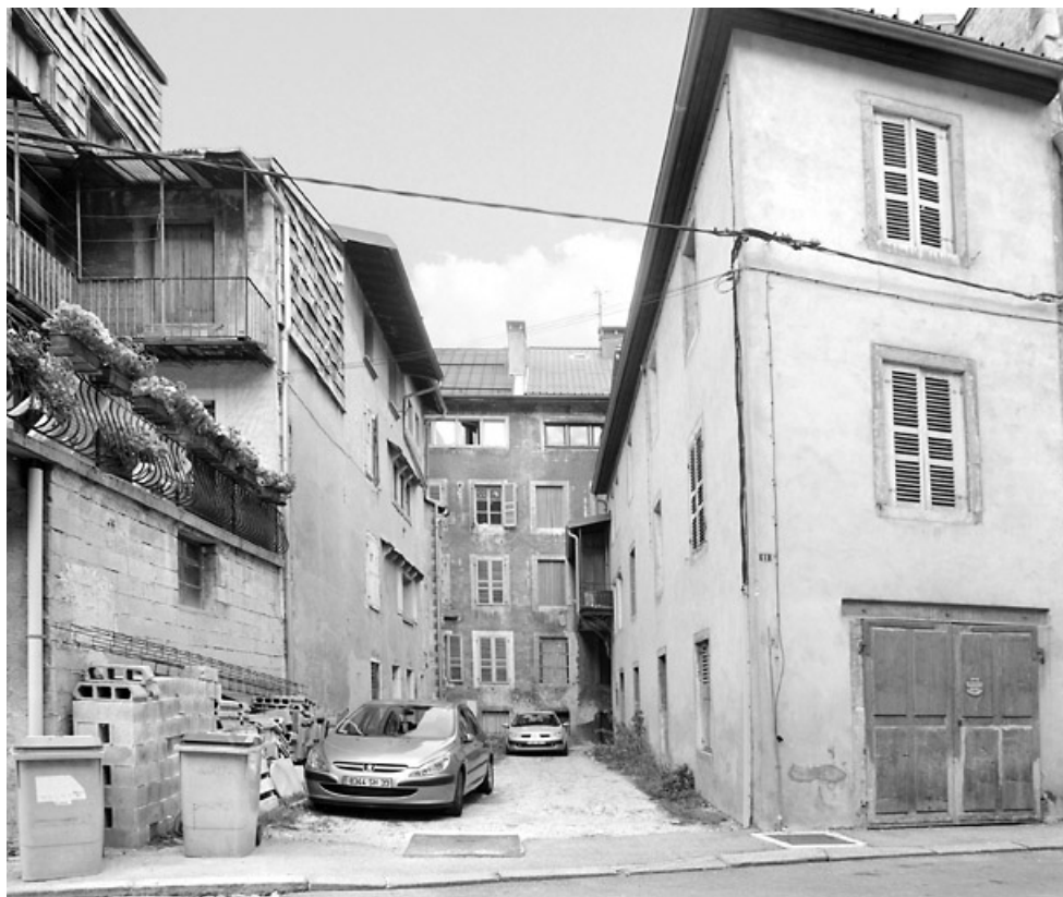
Cour et ailes, depuis la rue des Promenades.

39, Morez, 124, 126 rue de la République