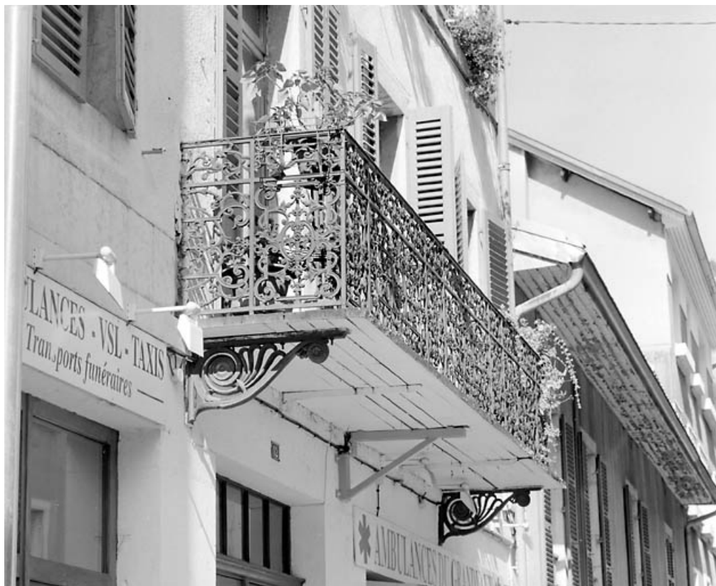
Elévation antérieure : balcon.