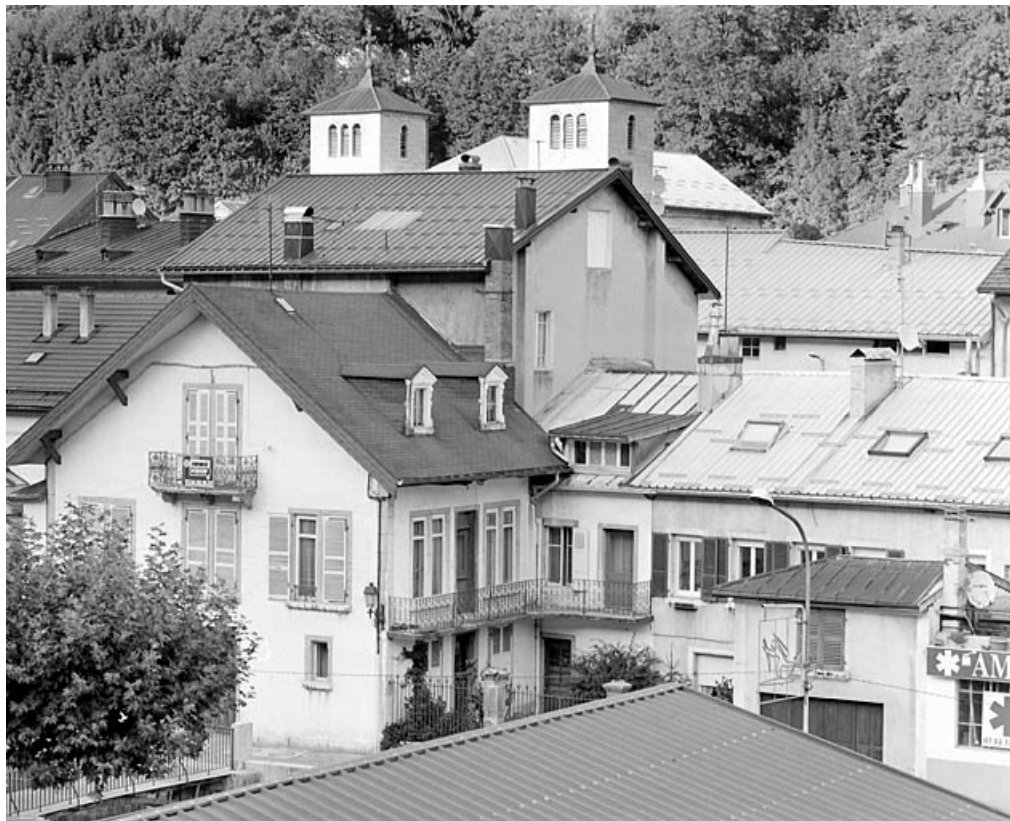
Vue d'ensemble plongeante.