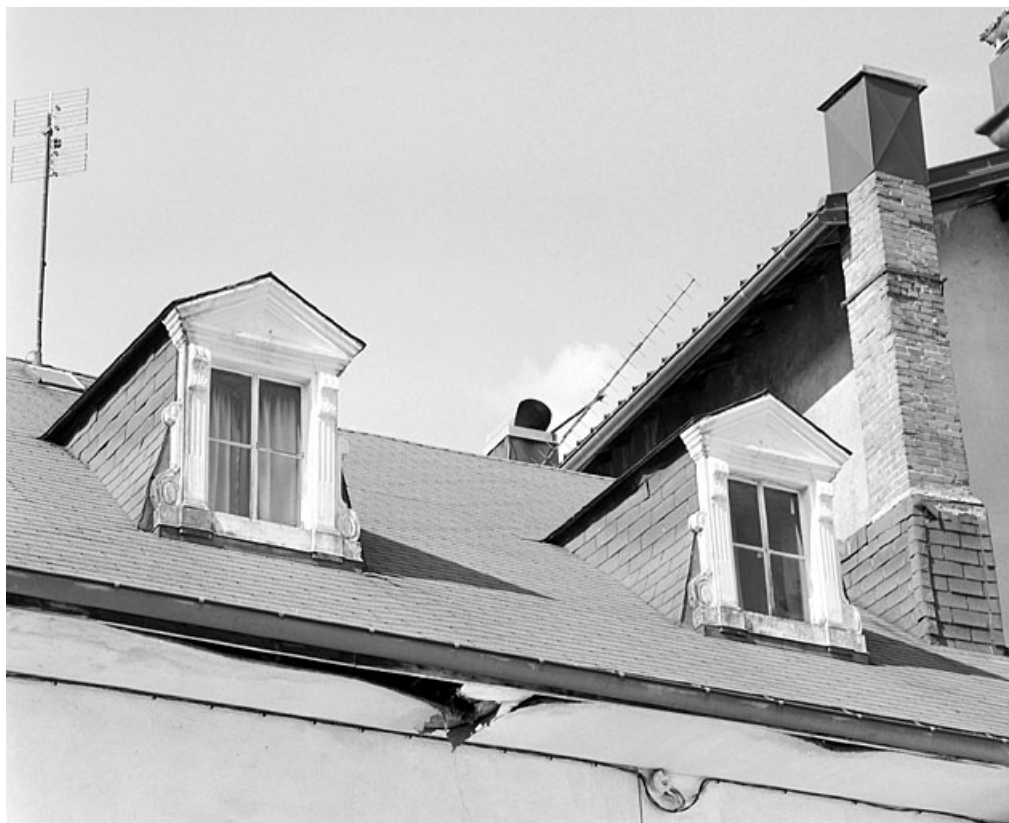
Lucarnes du versant sud.