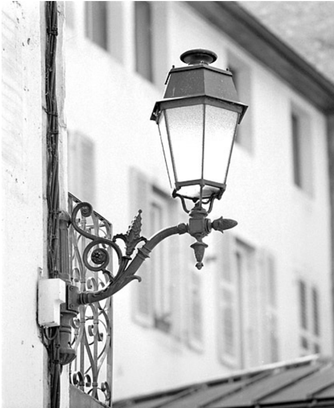
Lampadaire à l'angle sud de l'élévation antérieure.