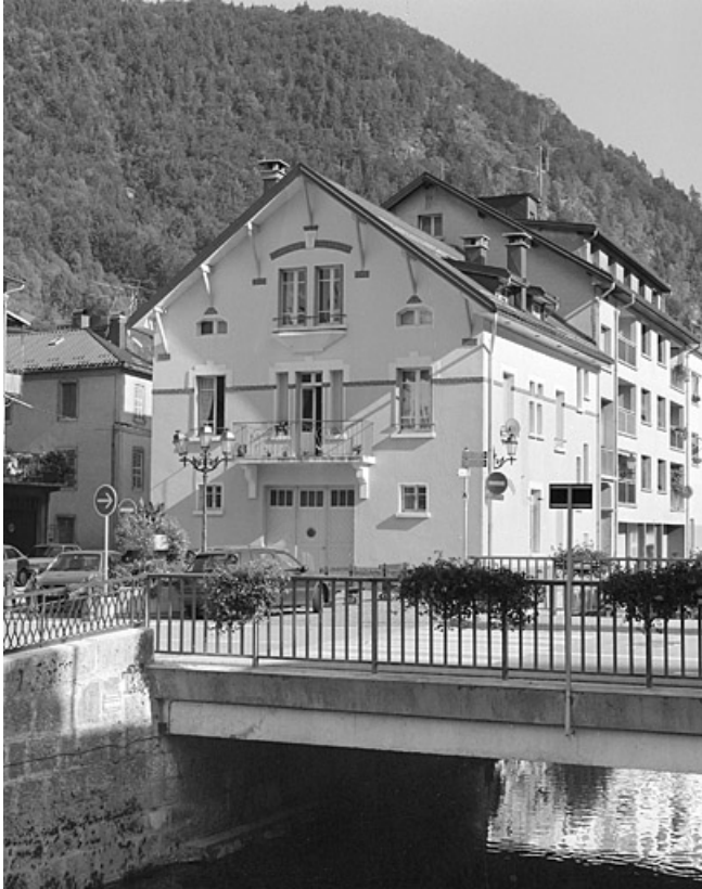
Vue d'ensemble, depuis l'ouest (cadrage vertical). 39, Morez Petit Quai 2