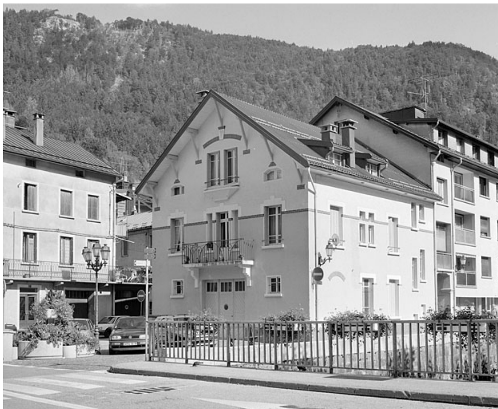
Façades antérieure et latérale droite. 39, Morez Petit Quai 2