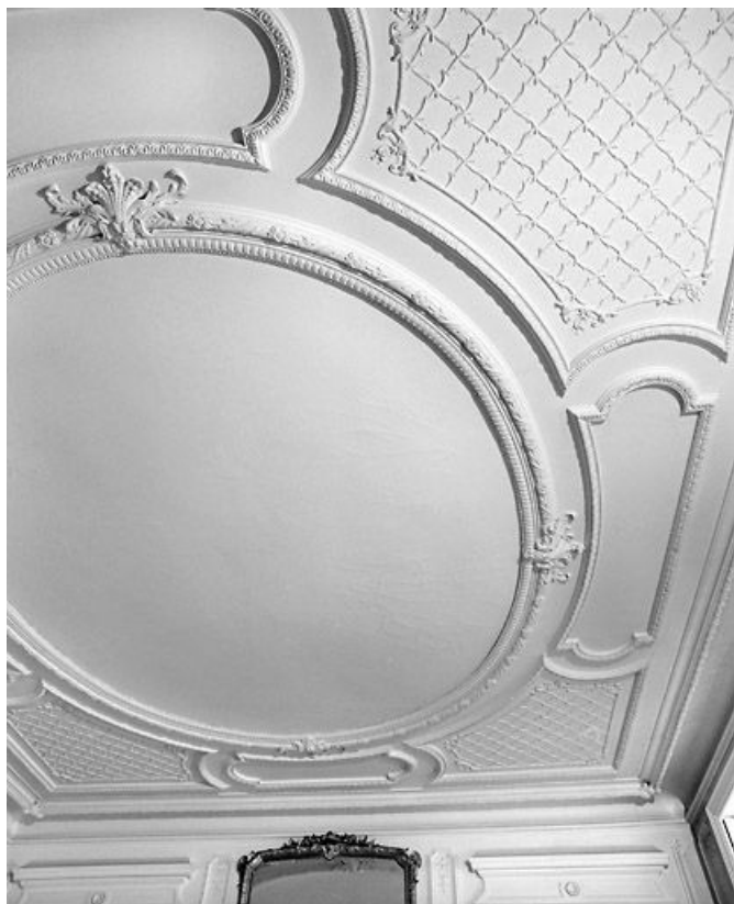
Grand salon : plafond.