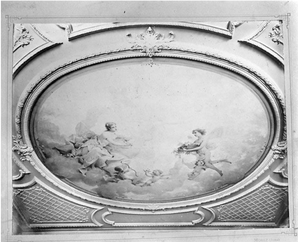
[Scène mythologique peinte au plafond du salon principal], [limite 19e siècle 20e siècle ?].