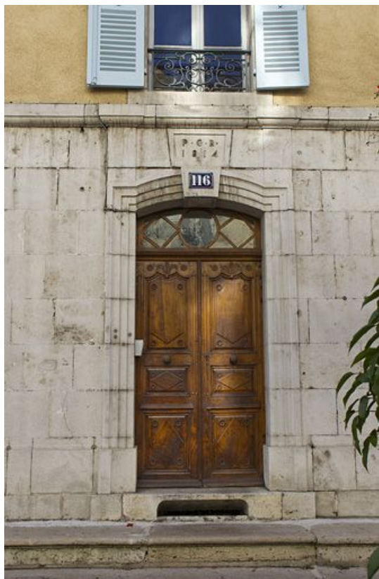
Façade antérieure : porte principale.