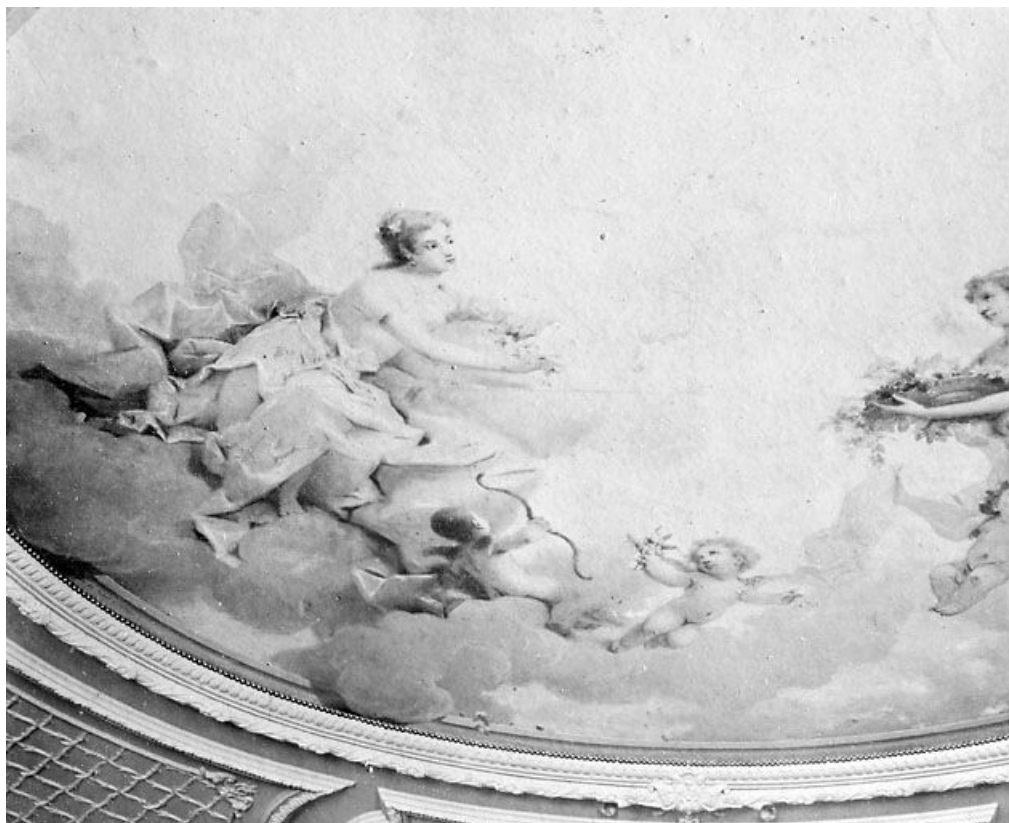
[Scène mythologique peinte au plafond du salon principal : détail de la partie gauche], [limite 19e siècle 20e siècle ?]. 39, Morez, 116 rue de la République