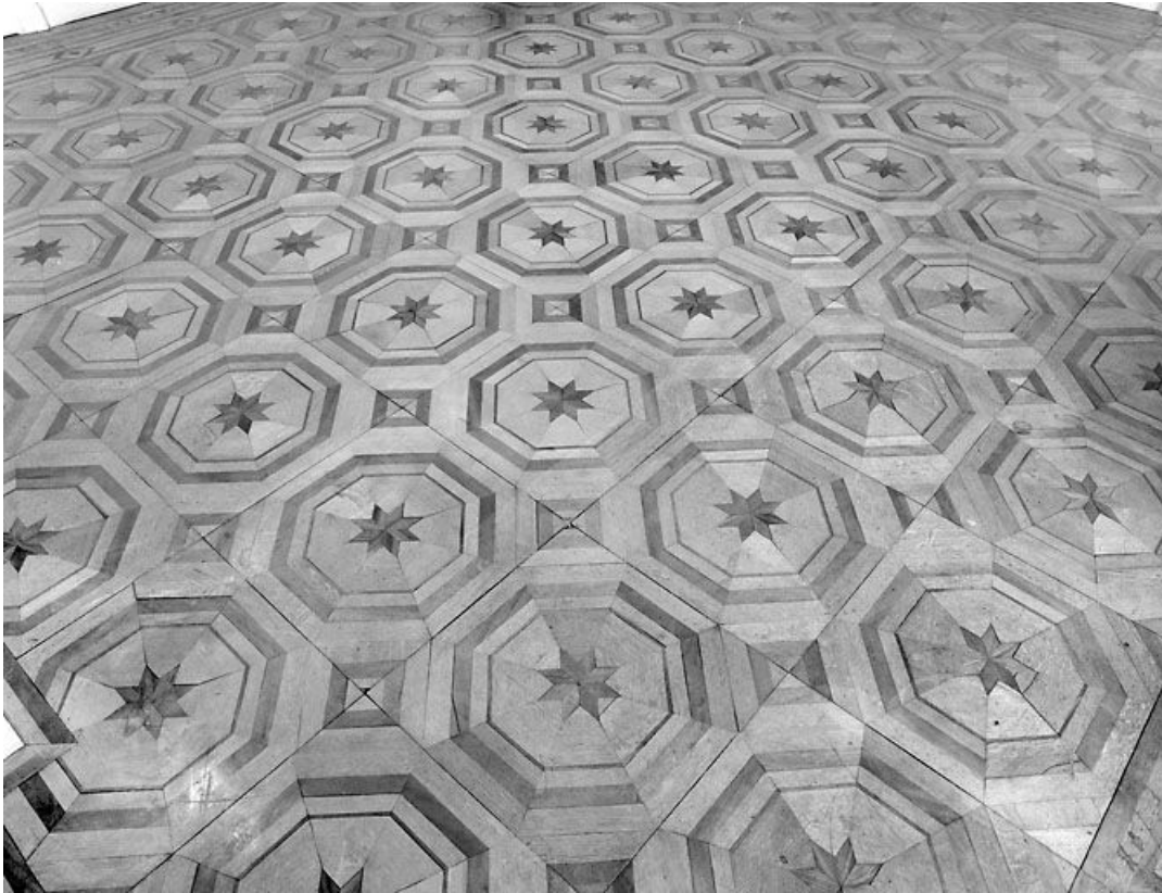
Grand salon : parquet en marqueterie.