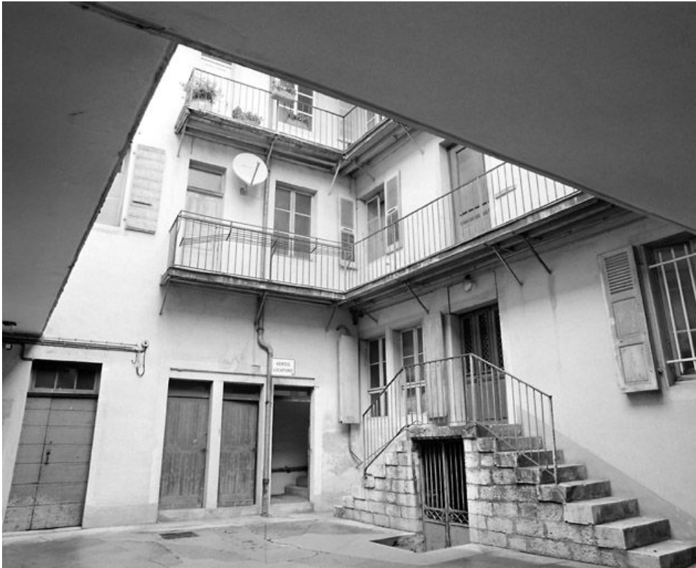
Façade postérieure, sur la cour, et corps de bâtiment nord.