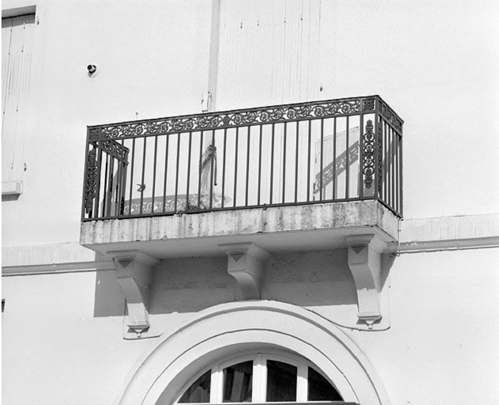
Façade latérale droite : balcon du premier étage.