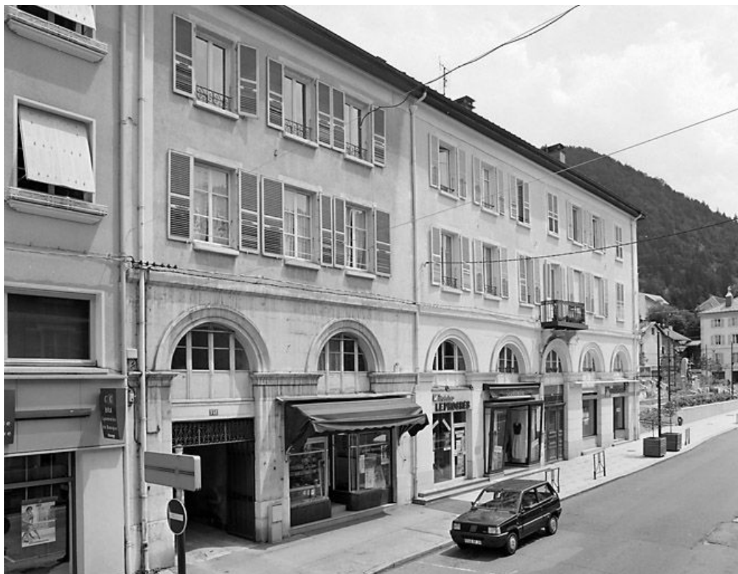
Immeuble avec atelier (19e siècle) aux n° 141-143 rue de la République. Immeuble (AE 99 à 101) bâti en 1836 puis agrandi en 1863-1864 (deux travées à gauche). C'est le seul immeuble repéré doté d'un entresol.