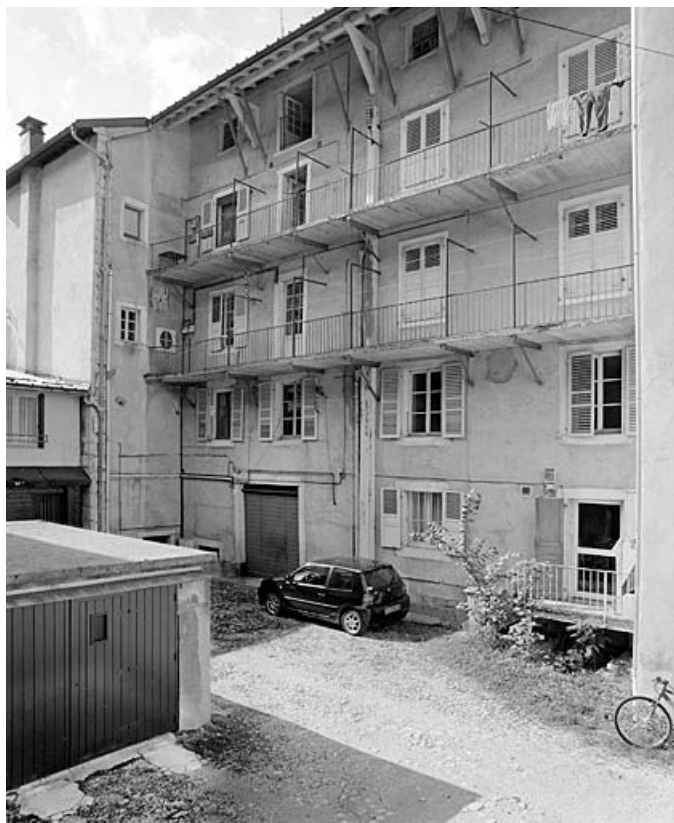
Façade postérieure du n° 143.