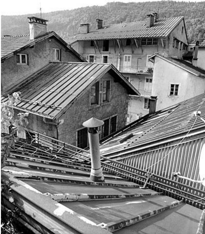
Toitures des bâtiments est et nord-est.