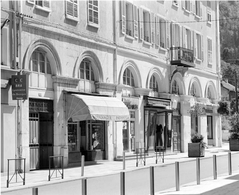
Façade antérieure : baies du rez-de-chaussée et de l'entresol, en enfilade.