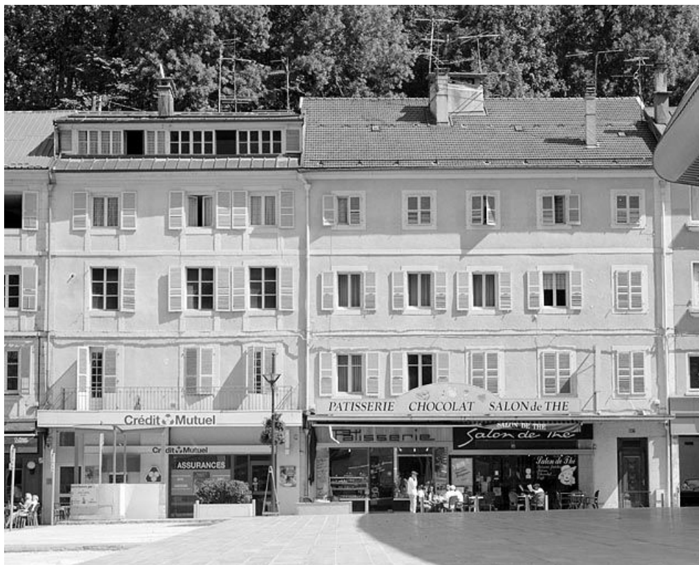
Immeubles (19e siècle) aux n° 135 et 137 rue de la République. Immeubles (AE 104 et 105) face à la place Jean Jaurès. Celui avec atelier, à gauche au n° 135, a été bâti durant la décennie 1830.