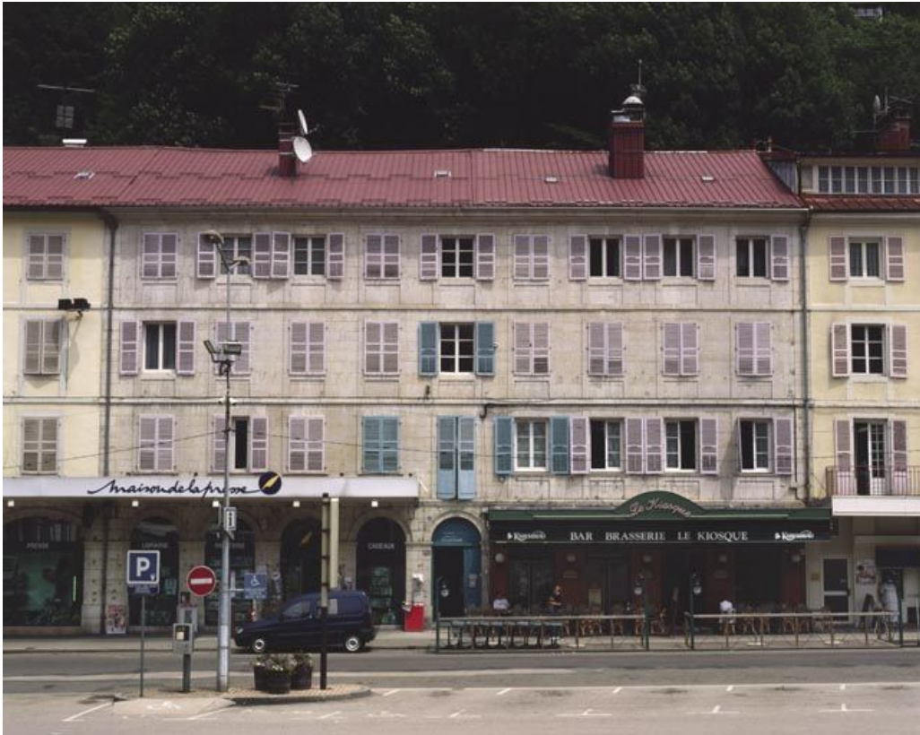
Vue d'ensemble des n° 131 et 133.