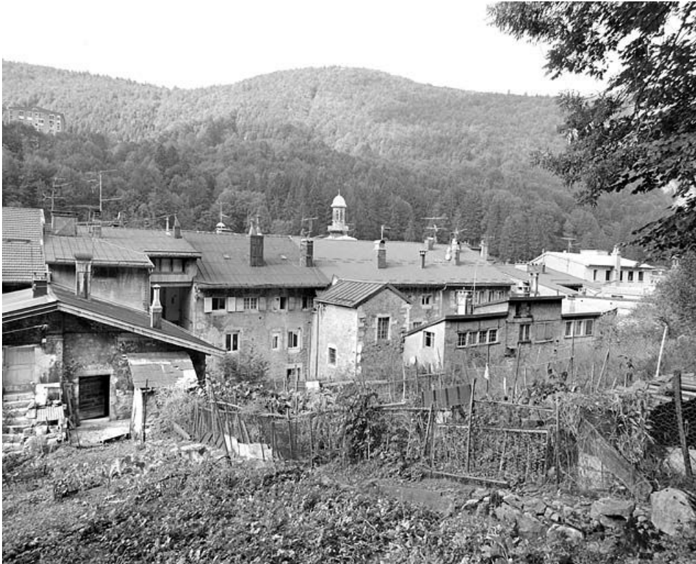
Vue d'ensemble des façades postérieures, de trois quarts gauche.