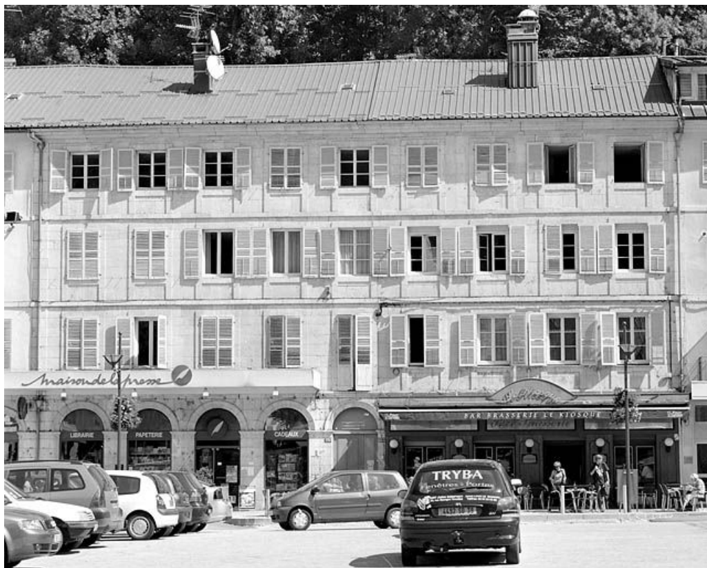
Immeuble avec atelier (19e siècle) aux n° 129 à 133 rue de la République. Immeuble (AE 107) face à la place Jean Jaurès, bâti au début de la décennie 1830.