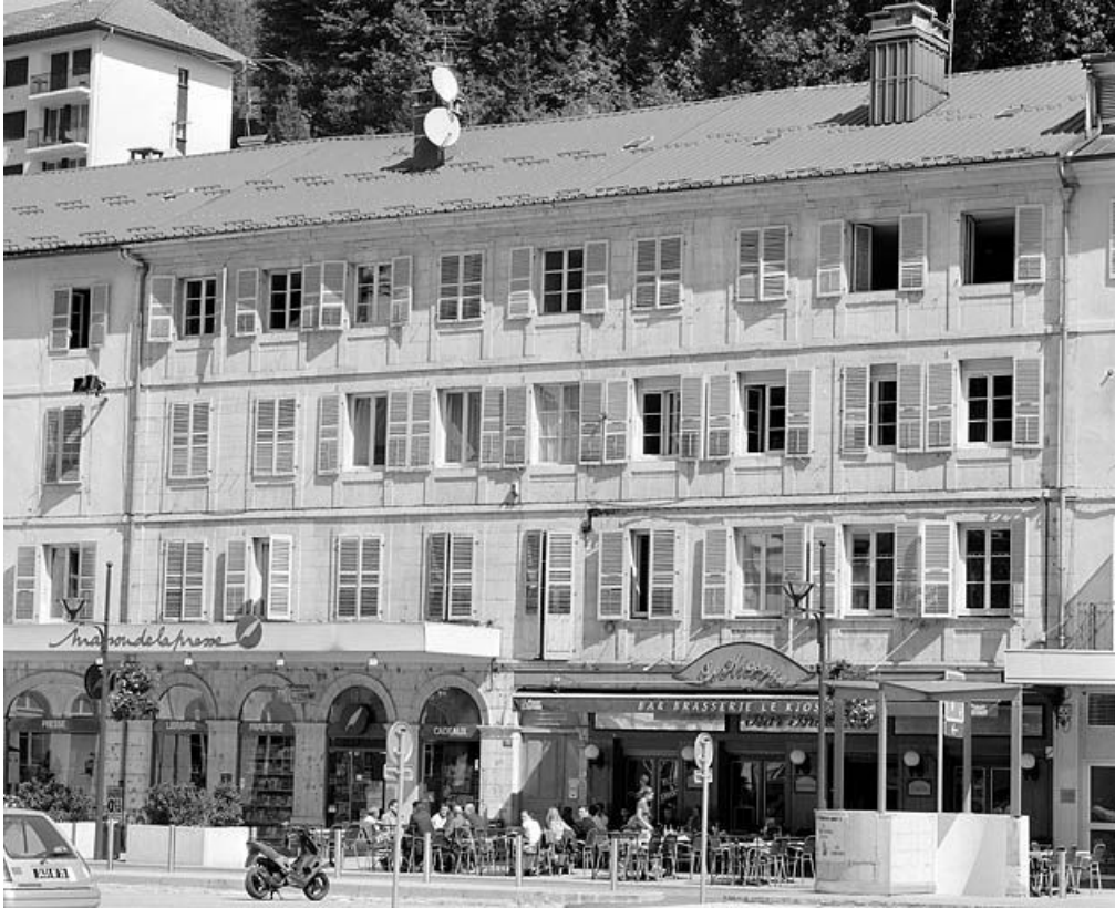
Vue d'ensemble des n° 131 et 133, de trois quarts droite.