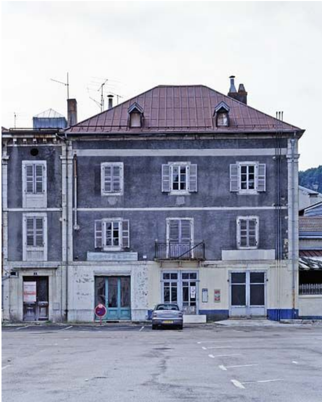
Le corps de bâtiment occidental.