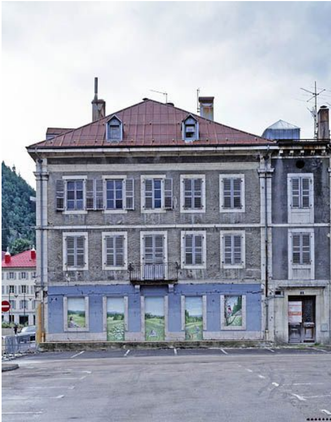
Le corps de bâtiment oriental.