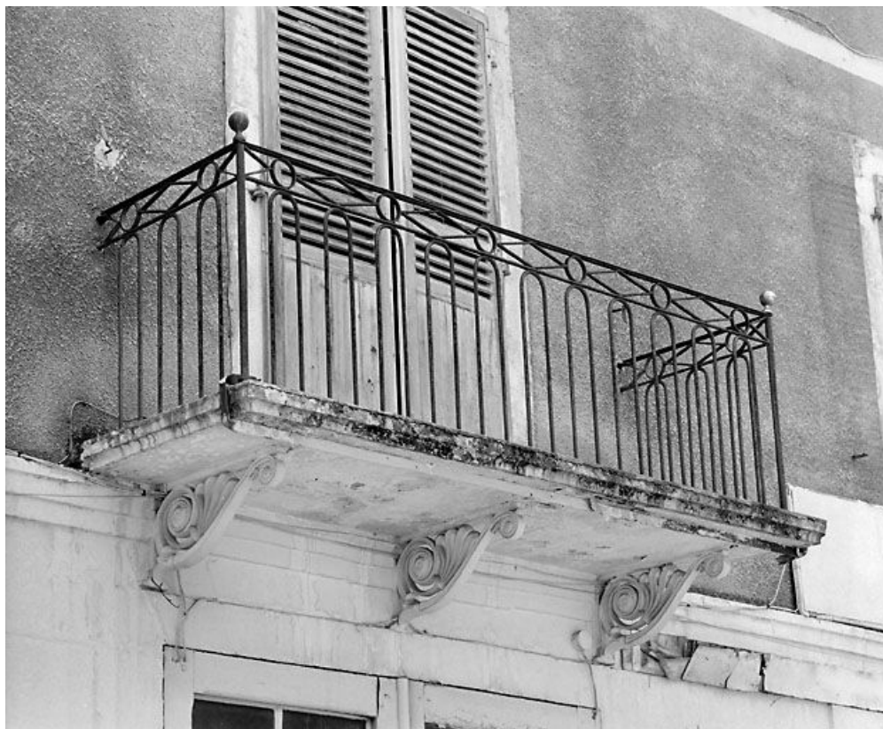
Balcon du corps de bâtiment occidental.