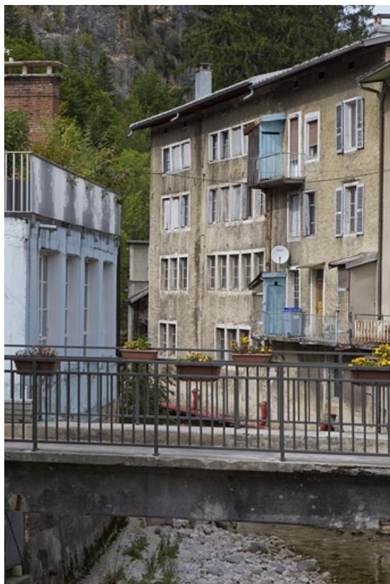
Façade postérieure de la maison et de l'atelier, depuis le sud.