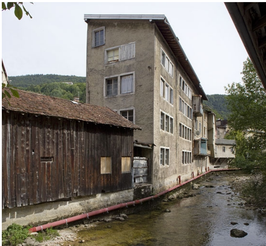
Façades postérieure et latérale gauche de l'atelier, depuis le nord.