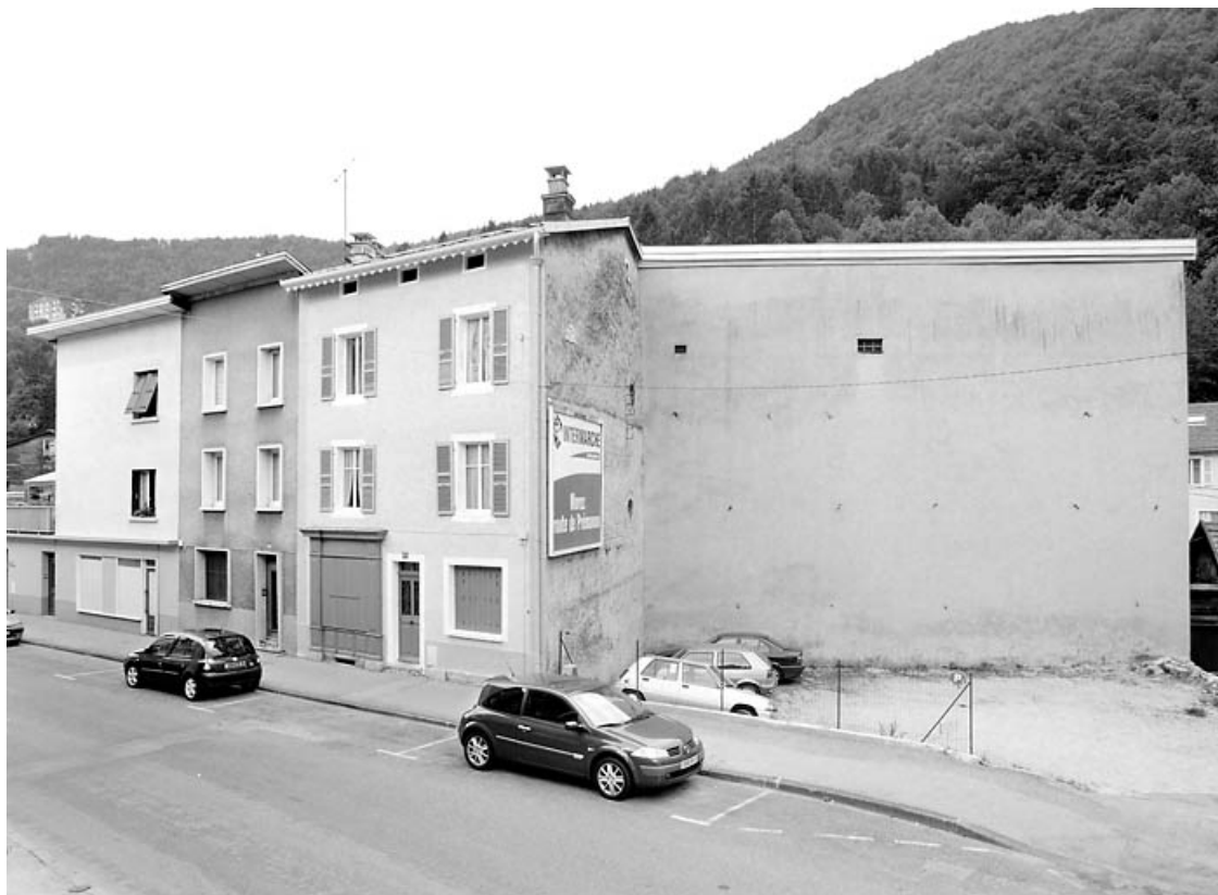
Vue d'ensemble, depuis le nord-est.