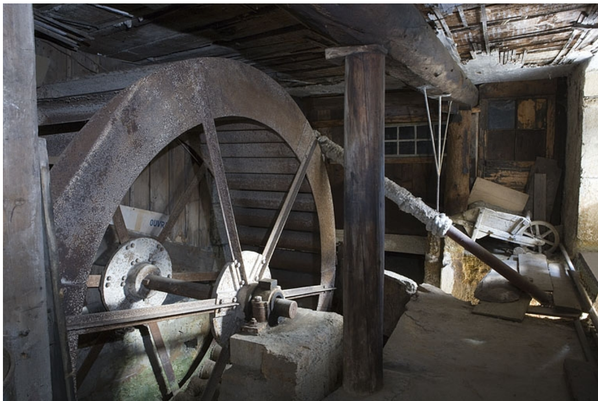
Roue hydraulique verticale, depuis l'aval. La Bienne se trouve à droite.