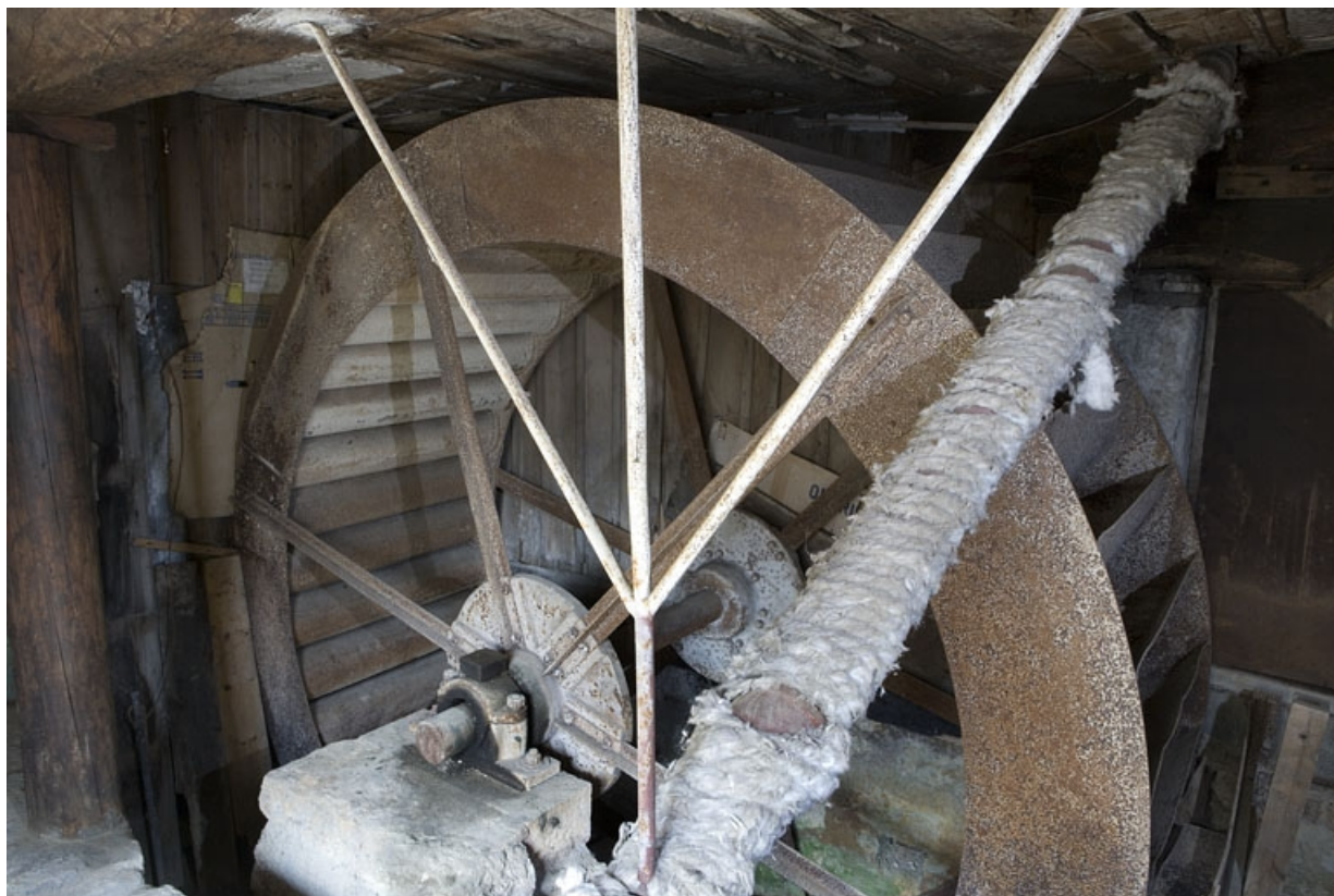
Roue hydraulique verticale, depuis l'amont.