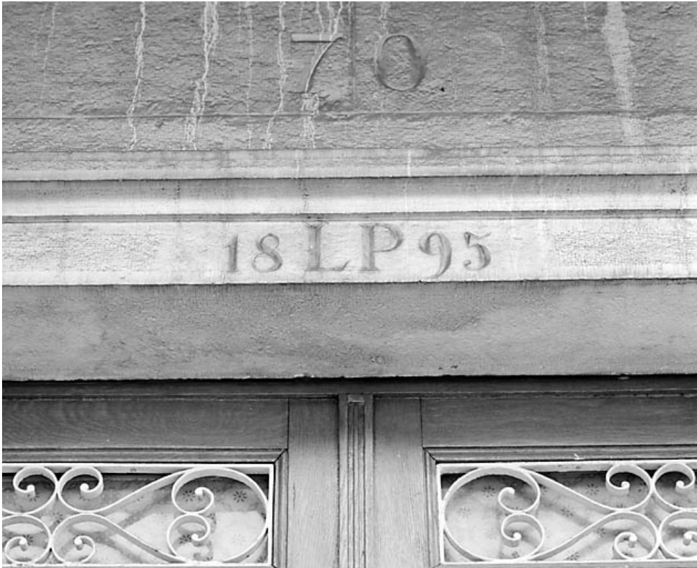
Linteau daté de la porte d'entrée, avant restauration.