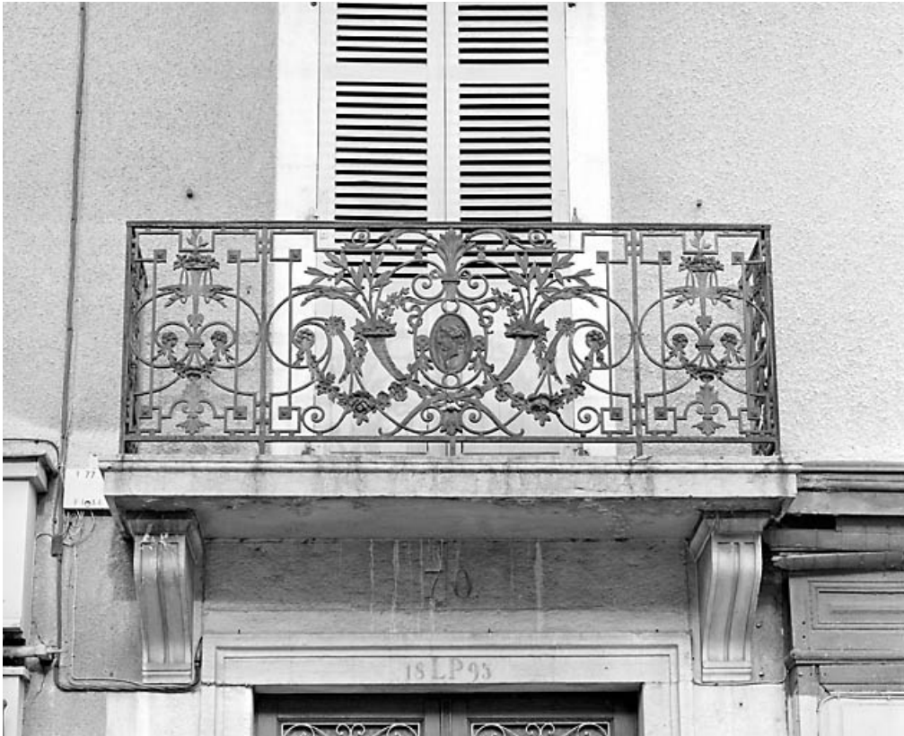
Balcon du premier étage, surmontant la porte d'entrée, avant restauration.