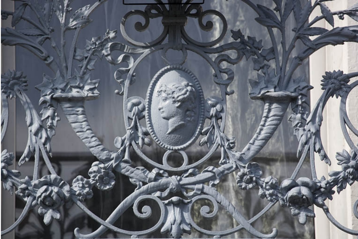
Ferronnerie du balcon du premier étage, surmontant la porte d'entrée.