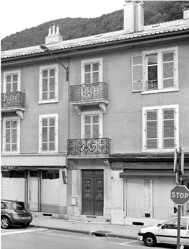
Façade antérieure, avant restauration : travée de la porte d'entrée. 39, Morez, 70 rue de la République