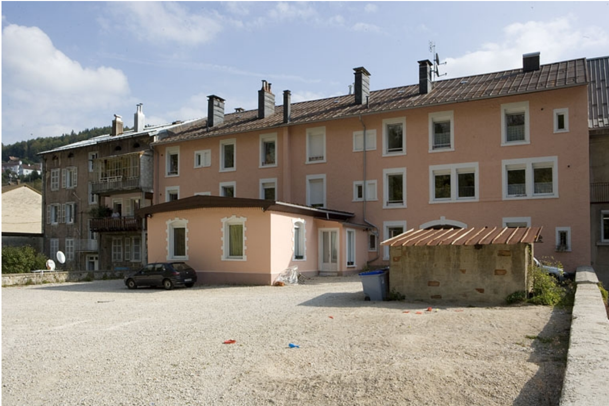
Façade postérieure, de trois quarts droite.