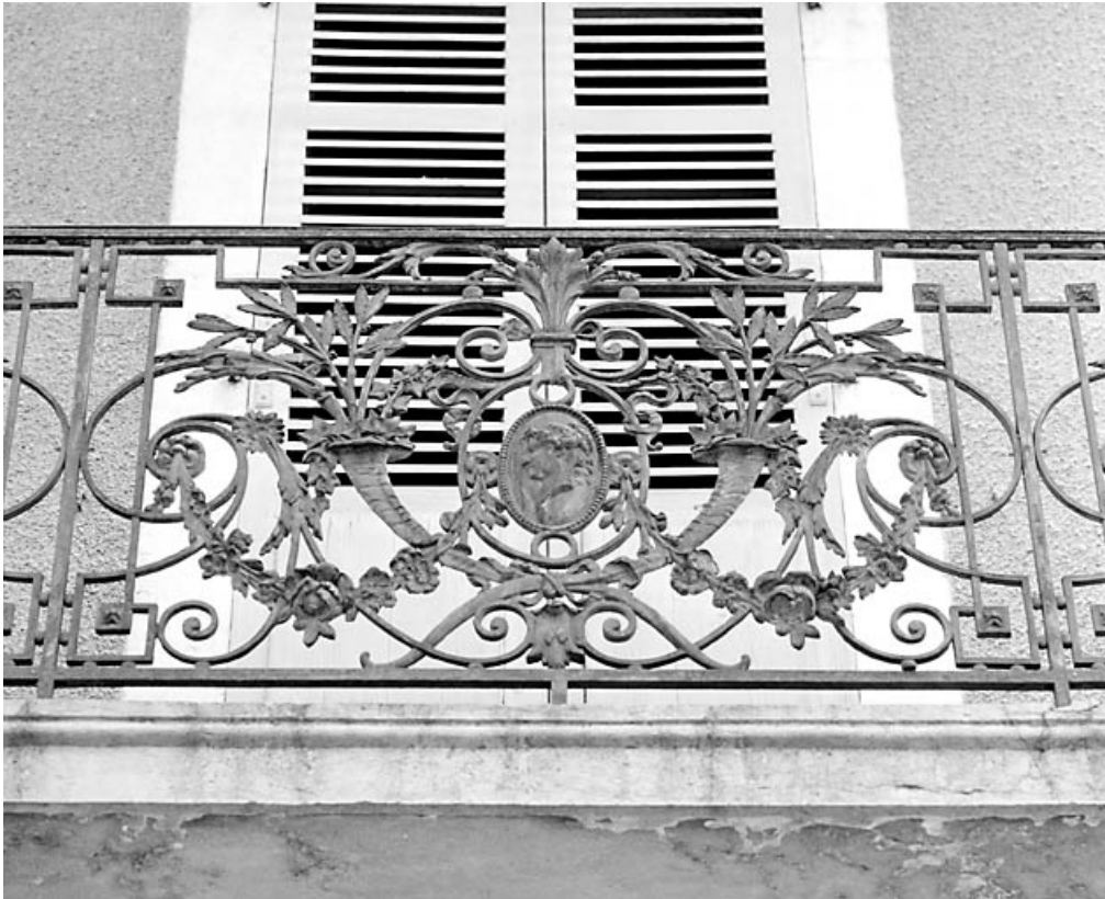
Ferronnerie du balcon du premier étage, surmontant la porte d'entrée, avant restauration. 39, Morez, 70 rue de la République