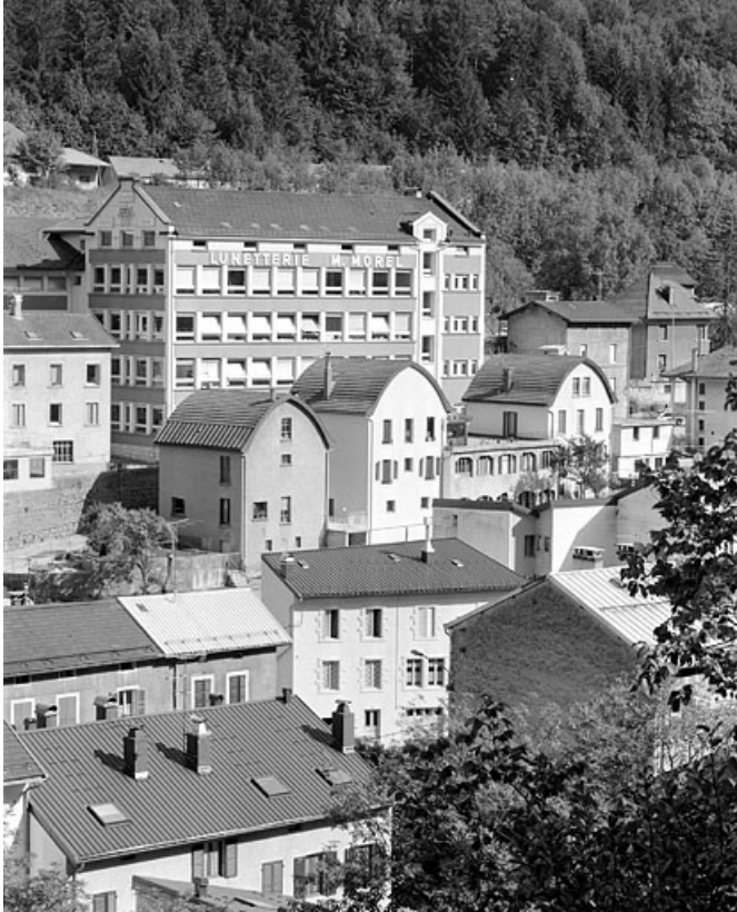
Vue d'ensemble plongeante, depuis le nord-ouest. Les deux bâtiments semblables à droite sont les logements de l'usine Pelletier et Cok.