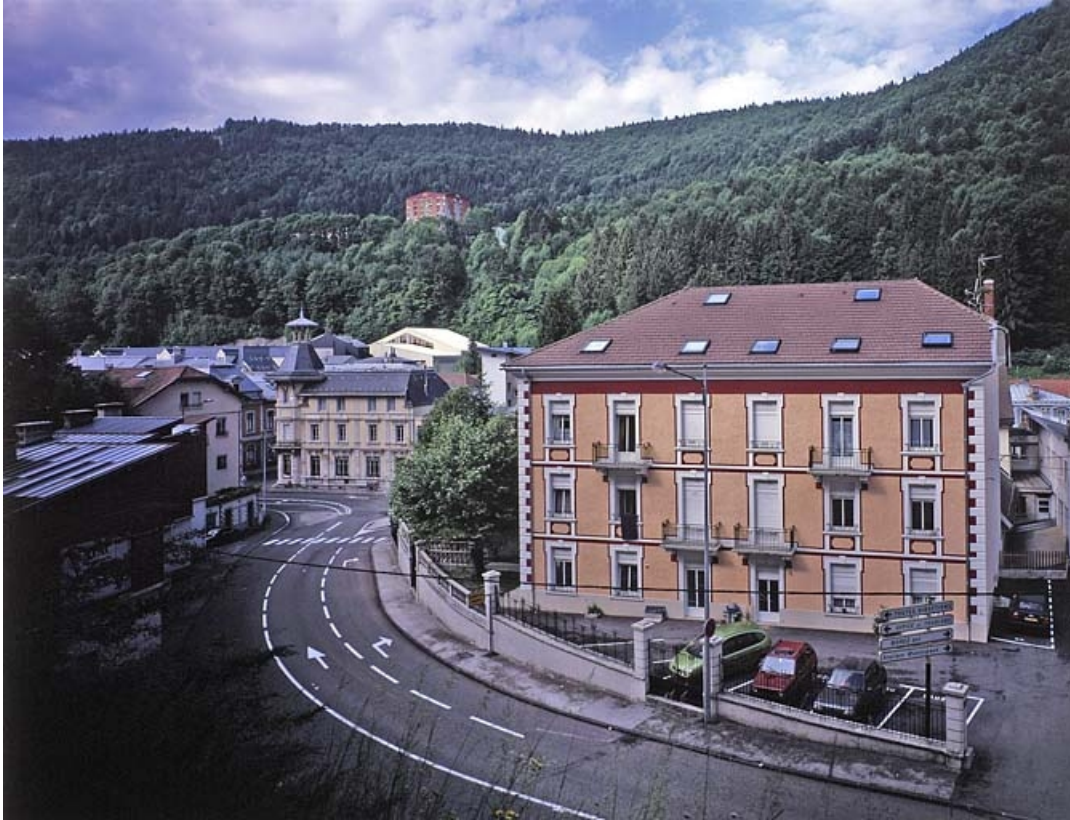
Vue d'ensemble plongeante, depuis l'est.