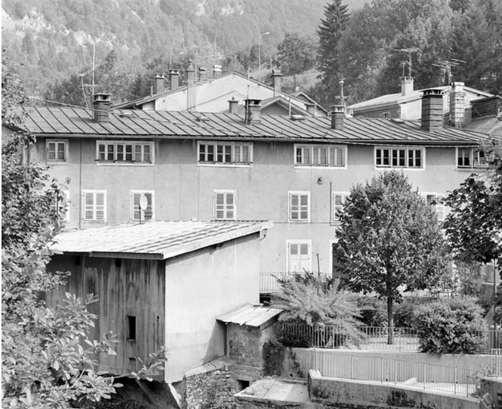
Façade principale : les deux étages carrés.