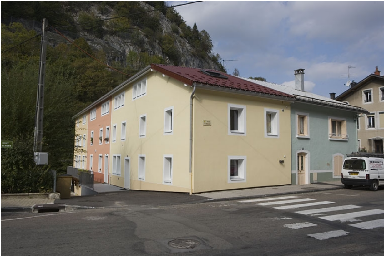
Vue de trois quarts, après restauration.