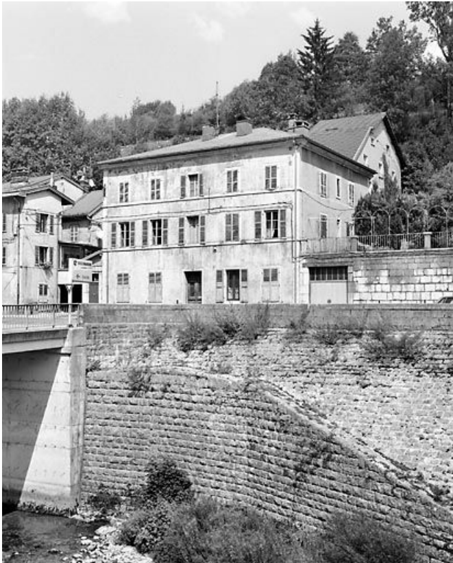
Vue d'ensemble, de trois quarts droite.

39, Morez, 35 et 35 bis rue de la République