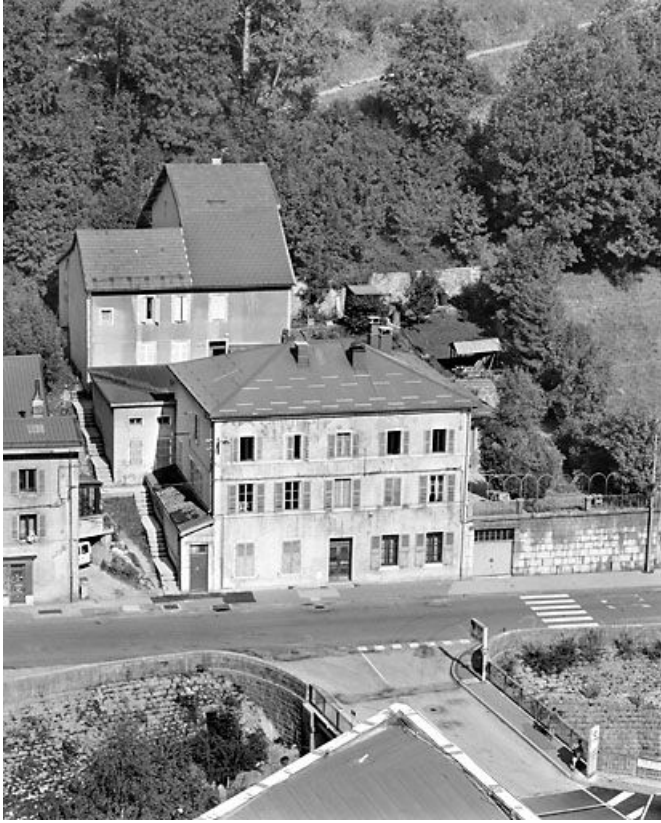
Maison avec atelier (19e siècle) aux n° 35 et 35 bis rue de la République. Maison (AD 211) bâtie vers 1840. 39, Morez, 35 et 35 bis rue de la République