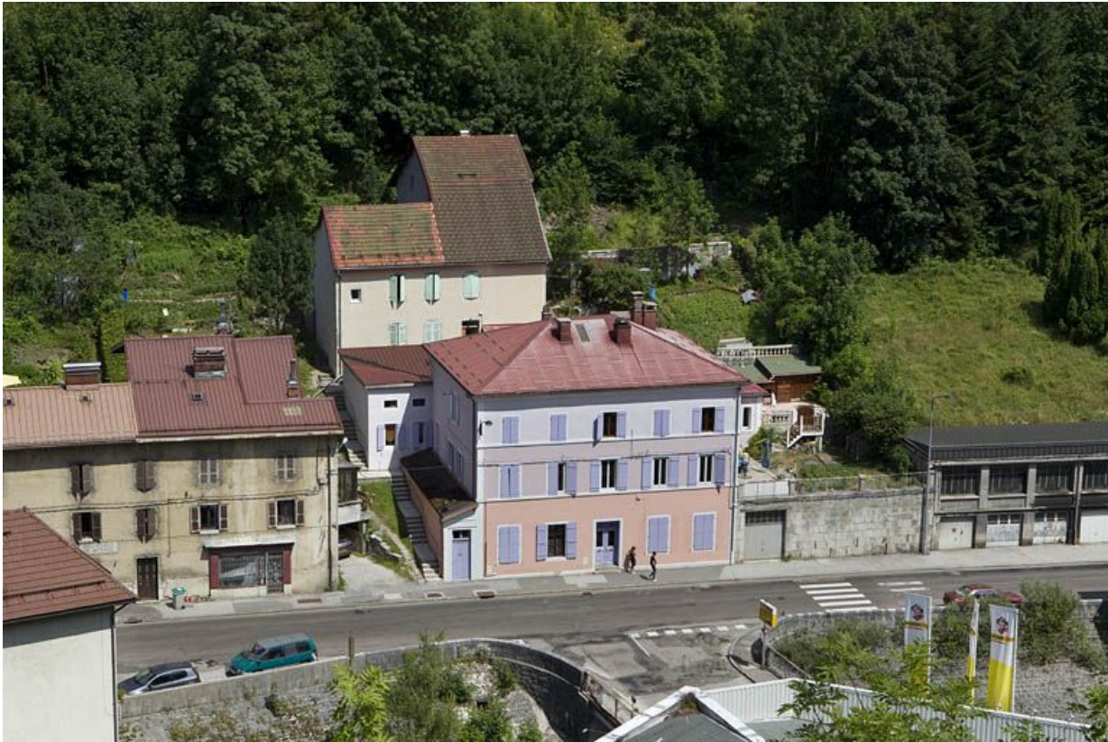
Vue d'ensemble plongeante, depuis l'ouest.

39, Morez, 35 et 35 bis rue de la République