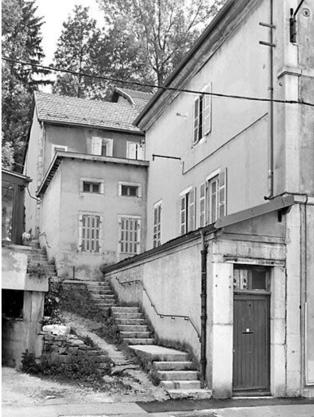
Façade latérale gauche.

39, Morez, 35 et 35 bis rue de la République