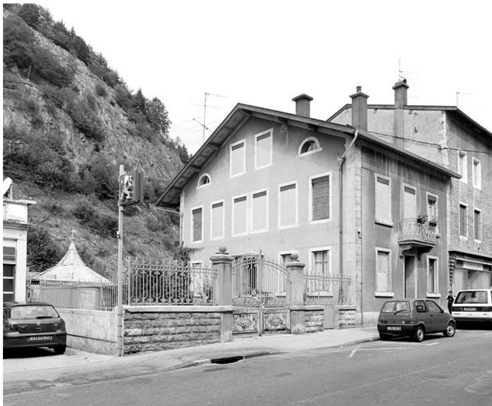
Vue d'ensemble, depuis le sud. 39, Morez, 34 rue de la République