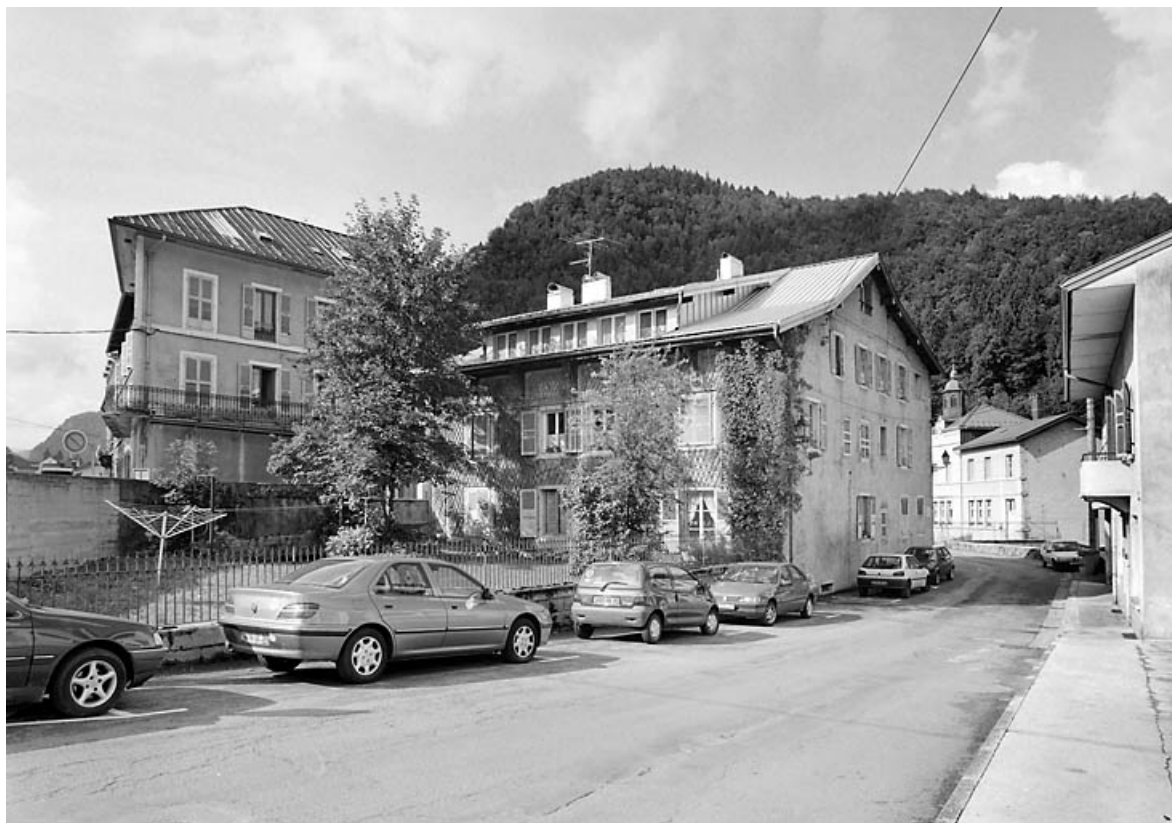
Elévations postérieure et latérale gauche.