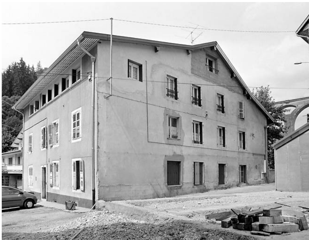
Elévations antérieure et latérale droite.