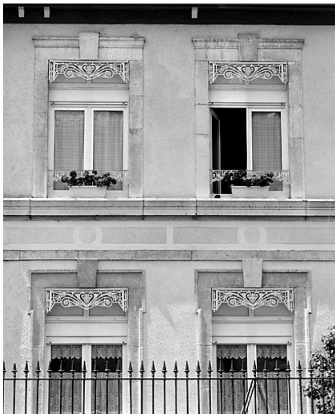
Élévation antérieure : baies.