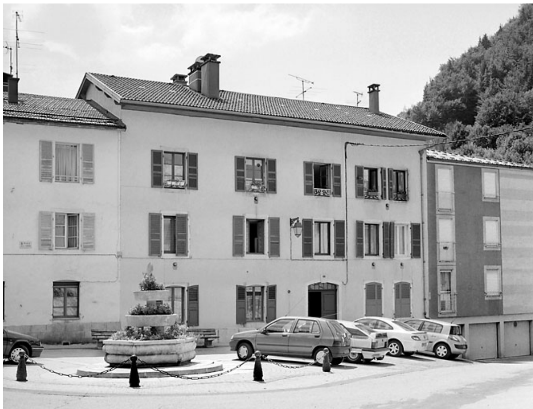
Elévation antérieure, de trois quarts gauche.