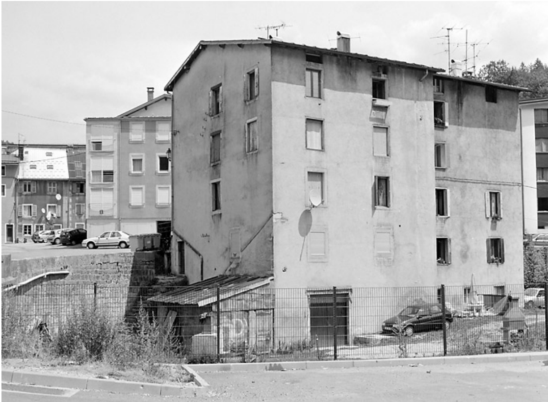
Élévation postérieure, de trois quarts gauche.