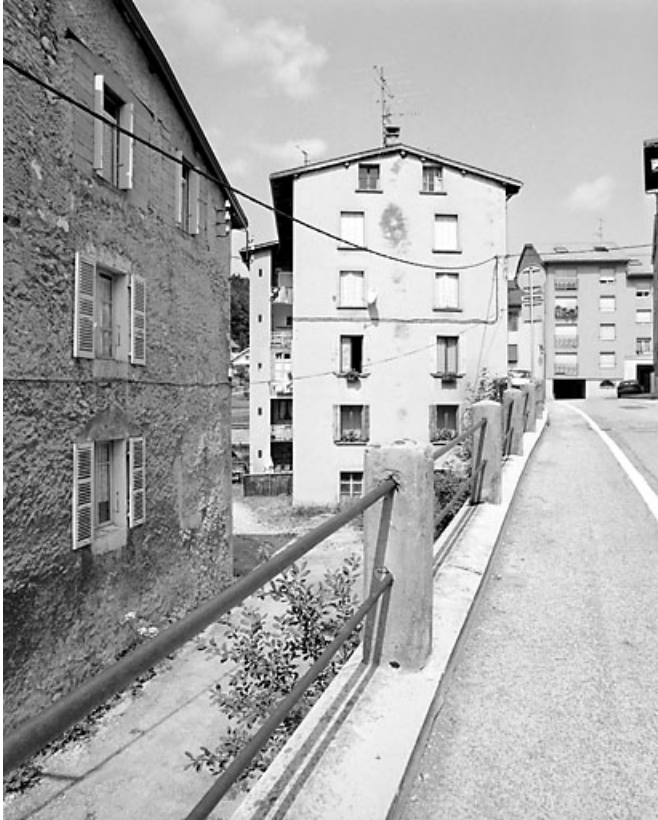
Élévation latérale gauche.