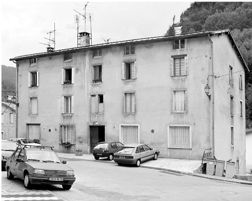
Elévation antérieure, de trois quarts droite.