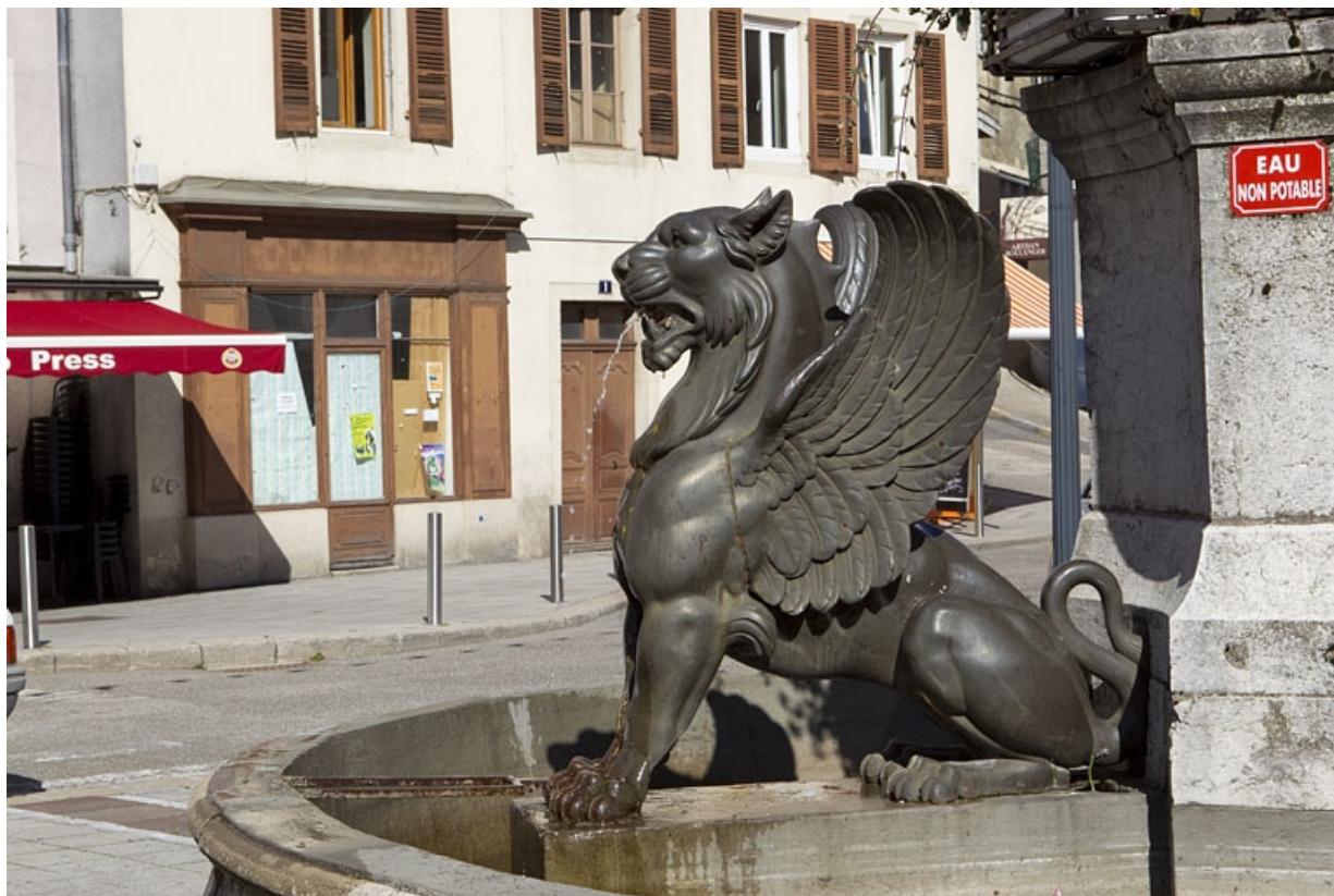
Le lion ailé sud-ouest, de profil droit.