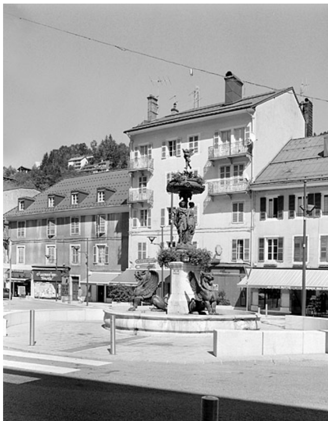
Vue d'ensemble, depuis le sud-ouest.