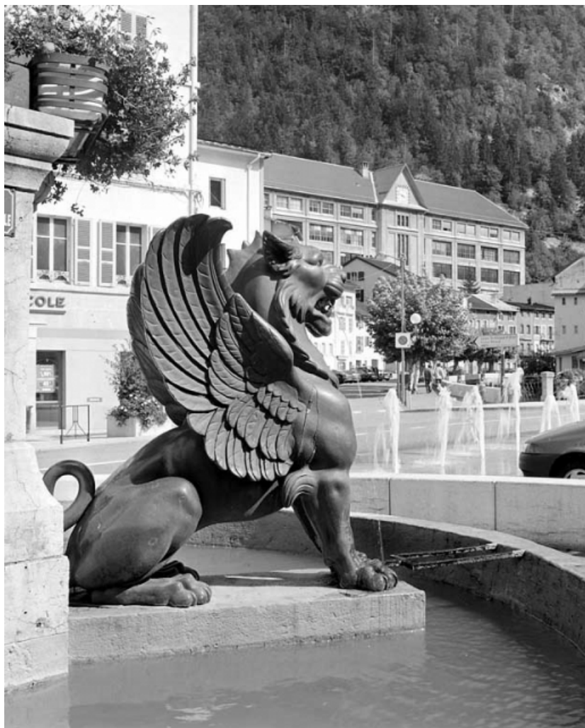
Le lion ailé sud-ouest, de profil gauche.