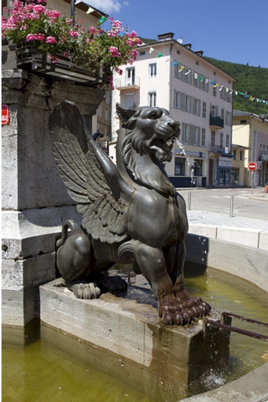
Le lion ailé sud-est.