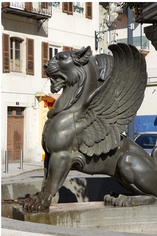
Fontaine aux lions, place Henri Lissac : l'un des lions ailés. 39, Morez