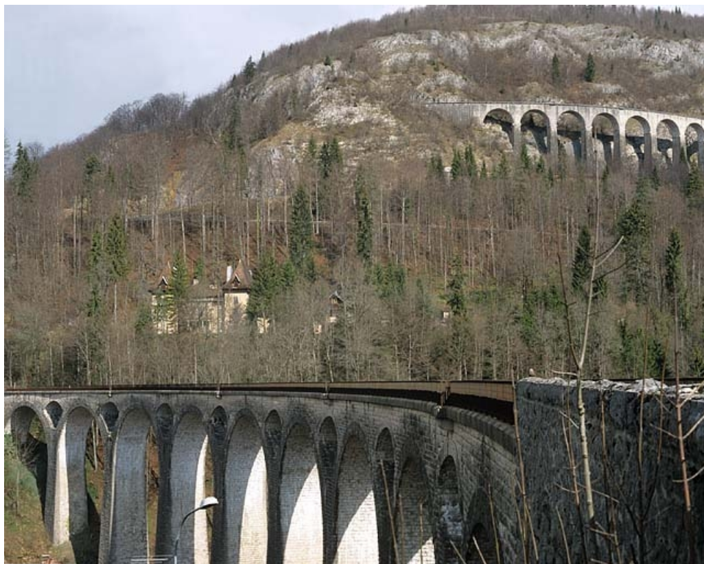
Vue d'ensemble, depuis le sud-est. Viaduc de Morez au premier plan, viaduc des Crottes à l'arrière-plan. 39, Morez rue Voltaire, lieudit : les Essards