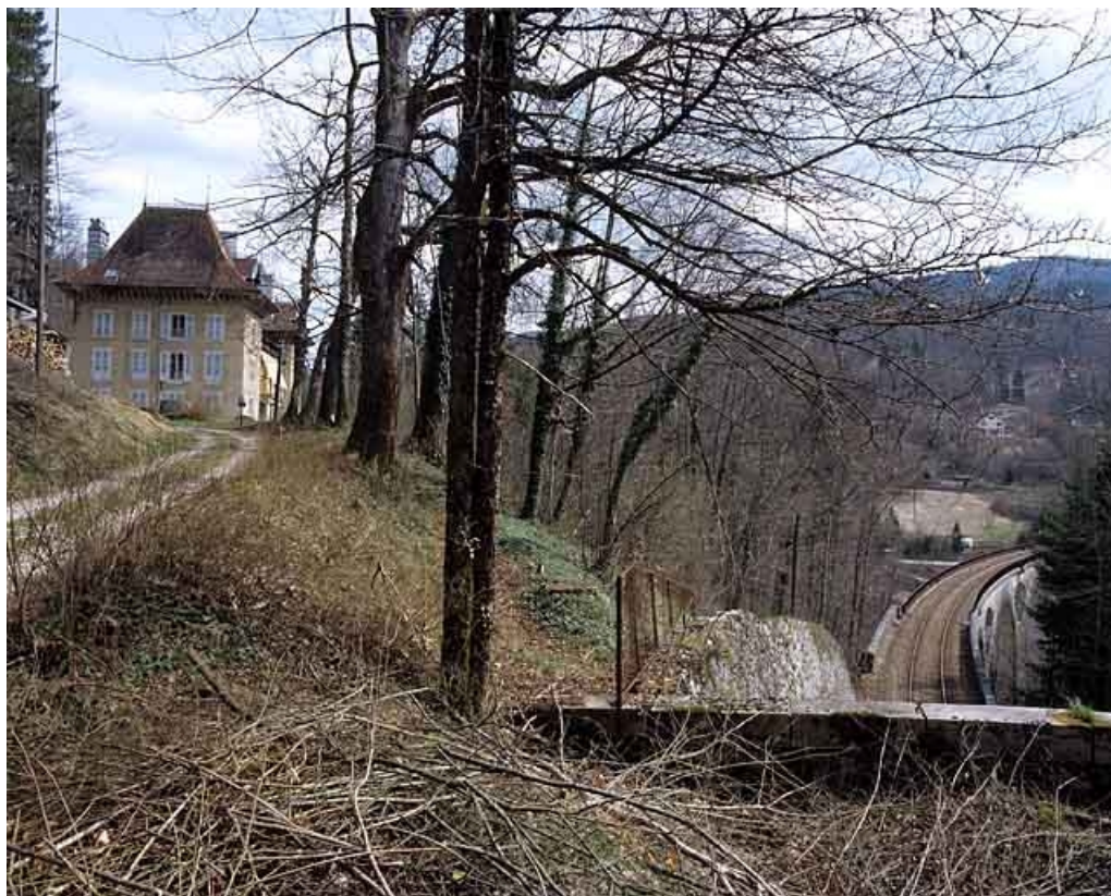
Vue d'ensemble, depuis l'ouest.

39, Morez rue Voltaire, lieudit : les Essards