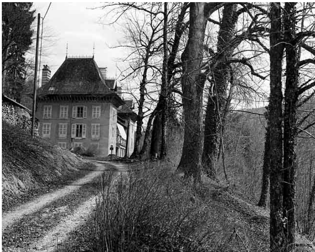
Vue d'ensemble rapprochée, depuis l'ouest.

39, Morez rue Voltaire, lieudit : les Essards