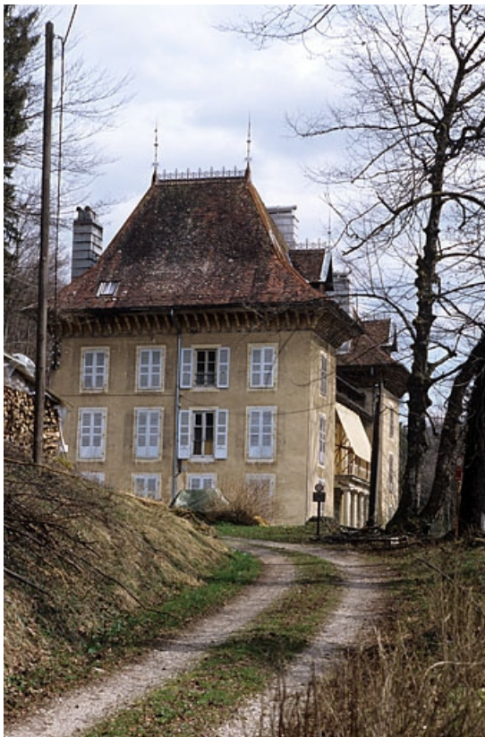
Façade antérieure, de trois quarts gauche.

39, Morez rue Voltaire, lieudit : les Essards