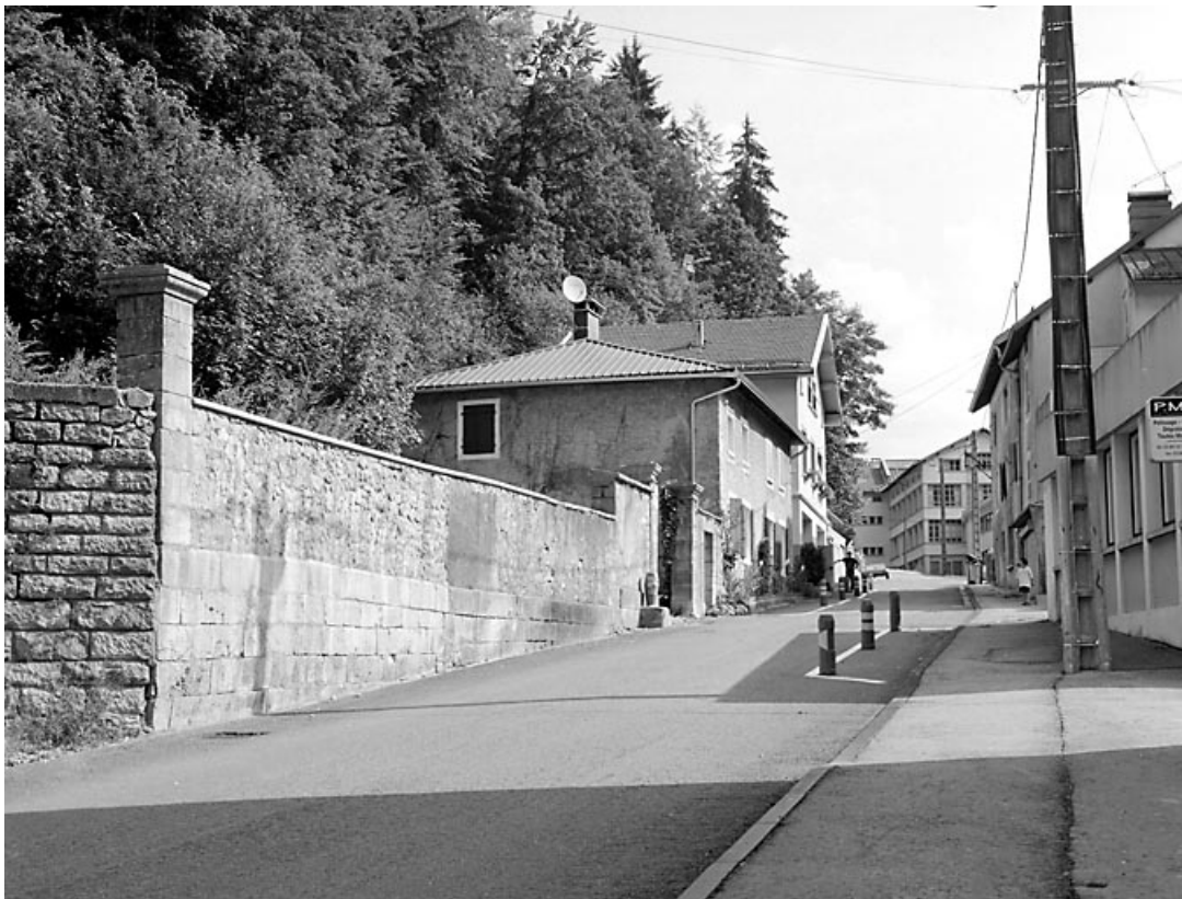
Entrée dans la rue Voltaire.

39, Morez rue Voltaire, lieudit : les Essards