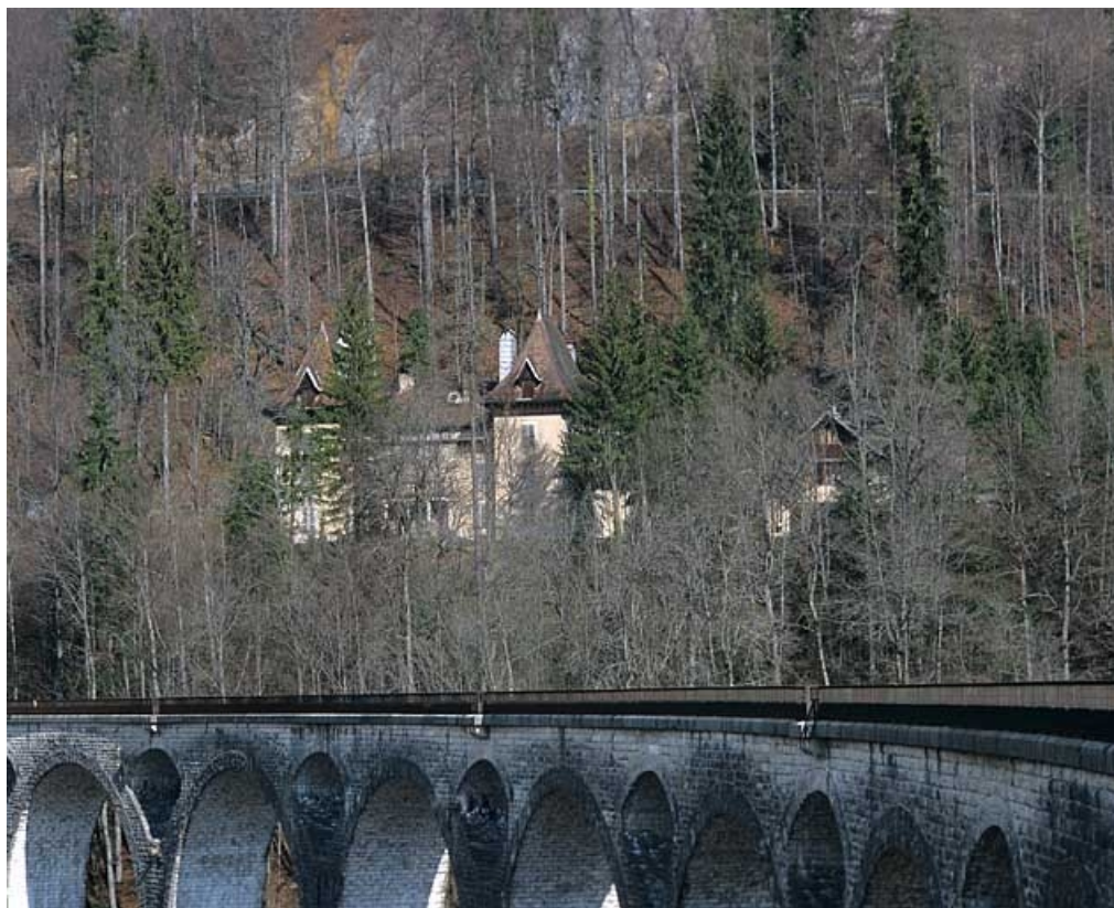
Vue d'ensemble rapprochée, depuis le sud-est.

39, Morez rue Voltaire, lieudit : les Essards