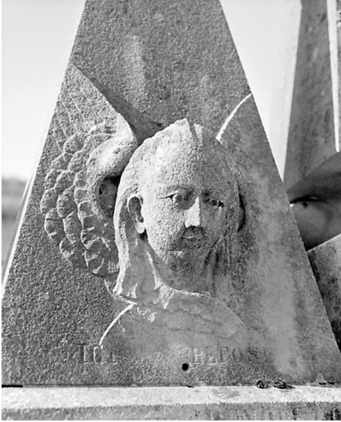
Tête de l'ange de gauche.

39, Morez, 10 allée du 3 Septembre, lieudit : cimetière, quartier 1