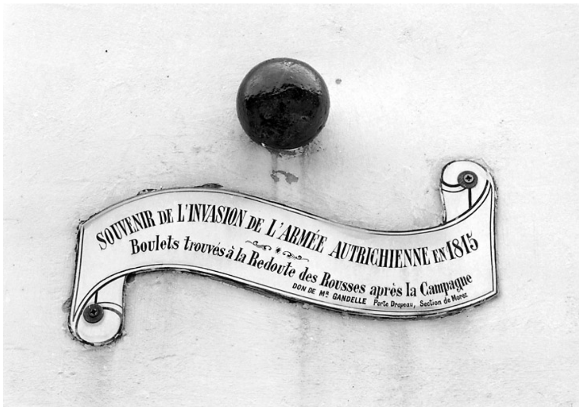
Boulet et plaque émaillée en partie basse de l'obélisque.

39, Morez, 10 allée du 3 Septembre, lieudit : cimetière, quartier 2