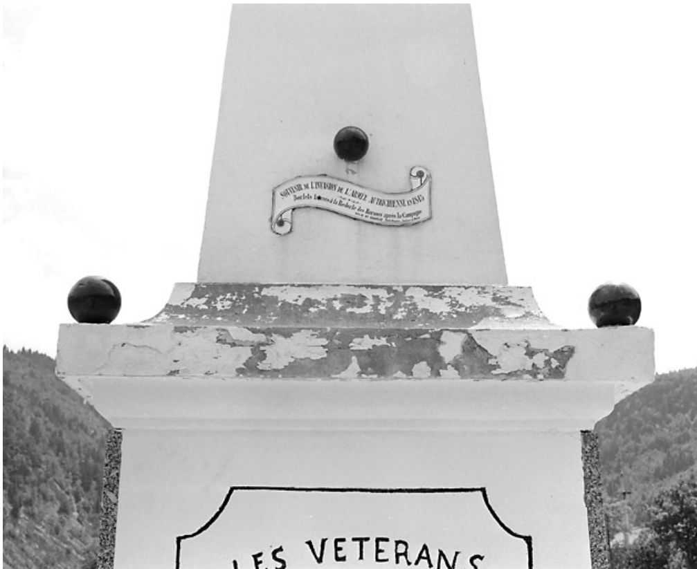
Boulets sur la corniche et en partie basse de l'obélisque.

39, Morez, 10 allée du 3 Septembre, lieudit : cimetière, quartier 2