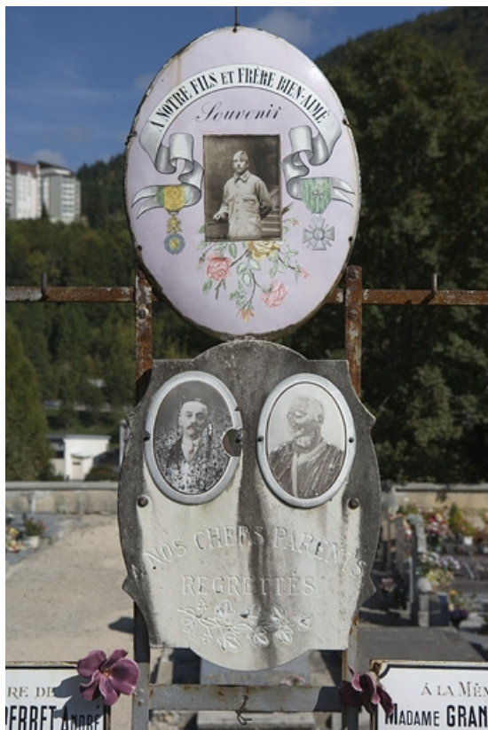
Deux des six plaques émaillées de la stèle.

39, Morez, 10 allée du 3 Septembre, lieudit : cimetière, quartier 3