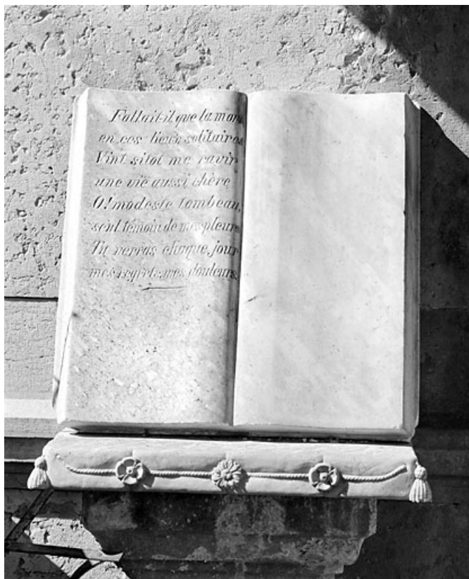
Livre et coussin en marbre.

39, Morez, 10 allée du 3 Septembre, lieudit : cimetière, quartier 3