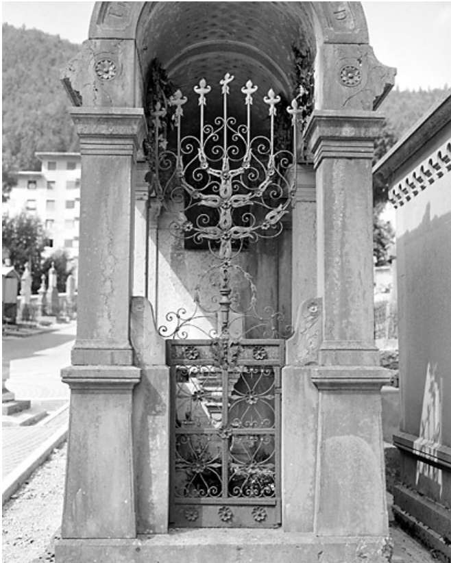
Façade antérieure : la grille.

39, Morez, 10 allée du 3 Septembre, lieudit : cimetière, quartier 3