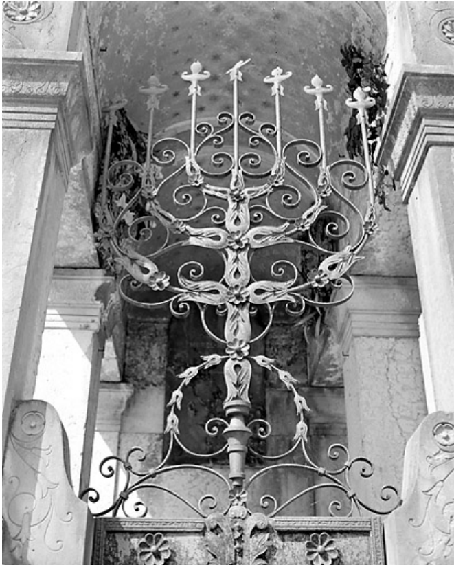
Grille : détail du chandelier.

39, Morez, 10 allée du 3 Septembre, lieudit : cimetière, quartier 3