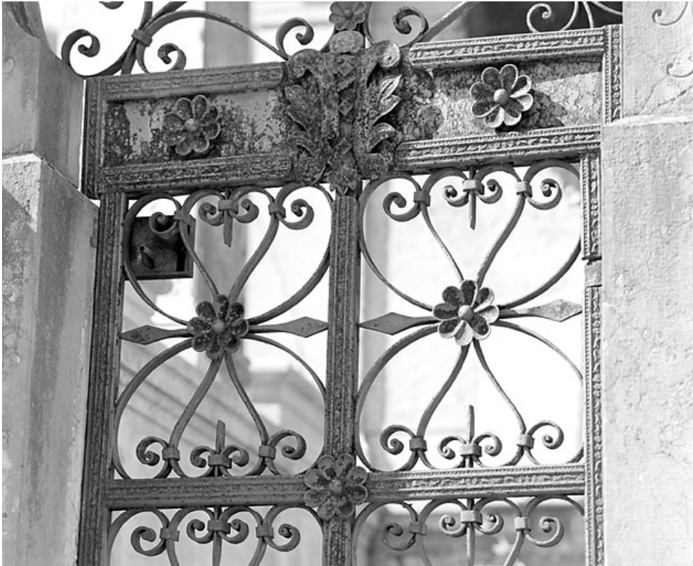
Grille : détail de la partie basse.

39, Morez, 10 allée du 3 Septembre, lieudit : cimetière, quartier 3