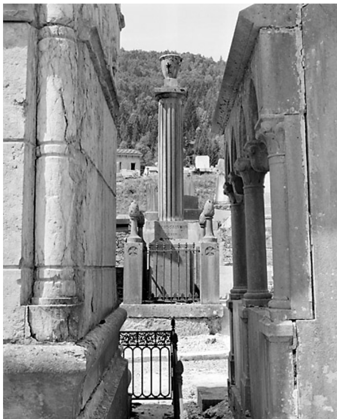
Vue d'ensemble, depuis le quartier 4 (nord-est).

39, Morez, 10 allée du 3 Septembre, lieudit : cimetière, quartier 3