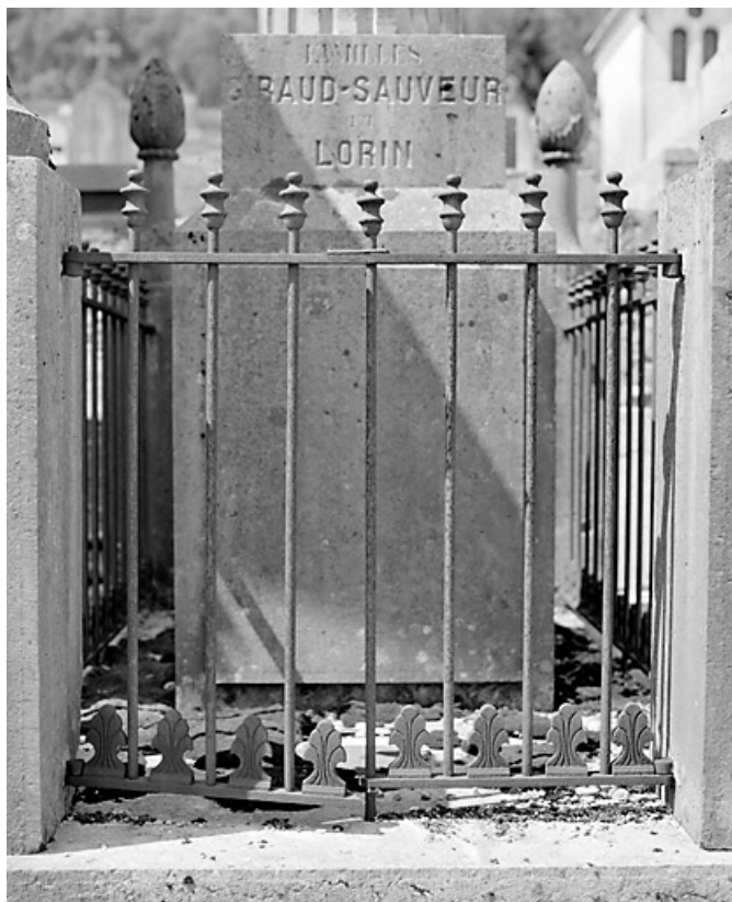
Grille, socle de la colonne et inscriptions.

39, Morez, 10 allée du 3 Septembre, lieudit : cimetière, quartier 3