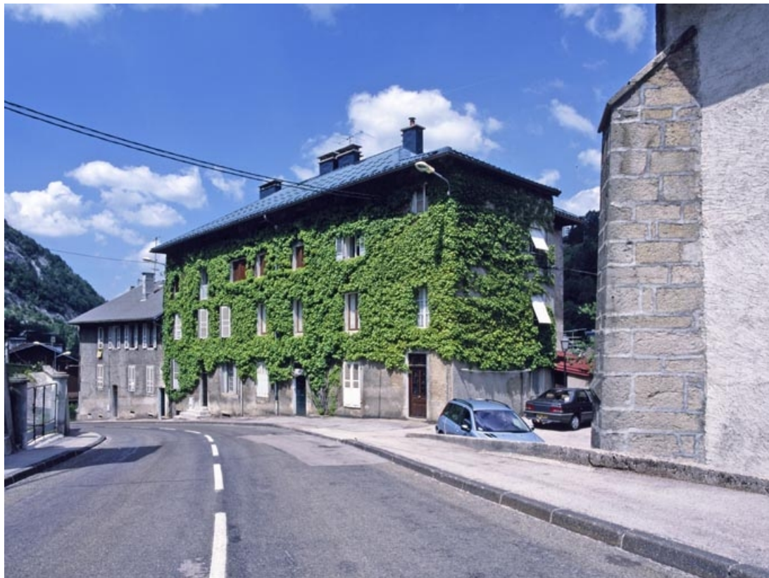
Vue d'ensemble, depuis le haut de la rue Pasteur (sud).