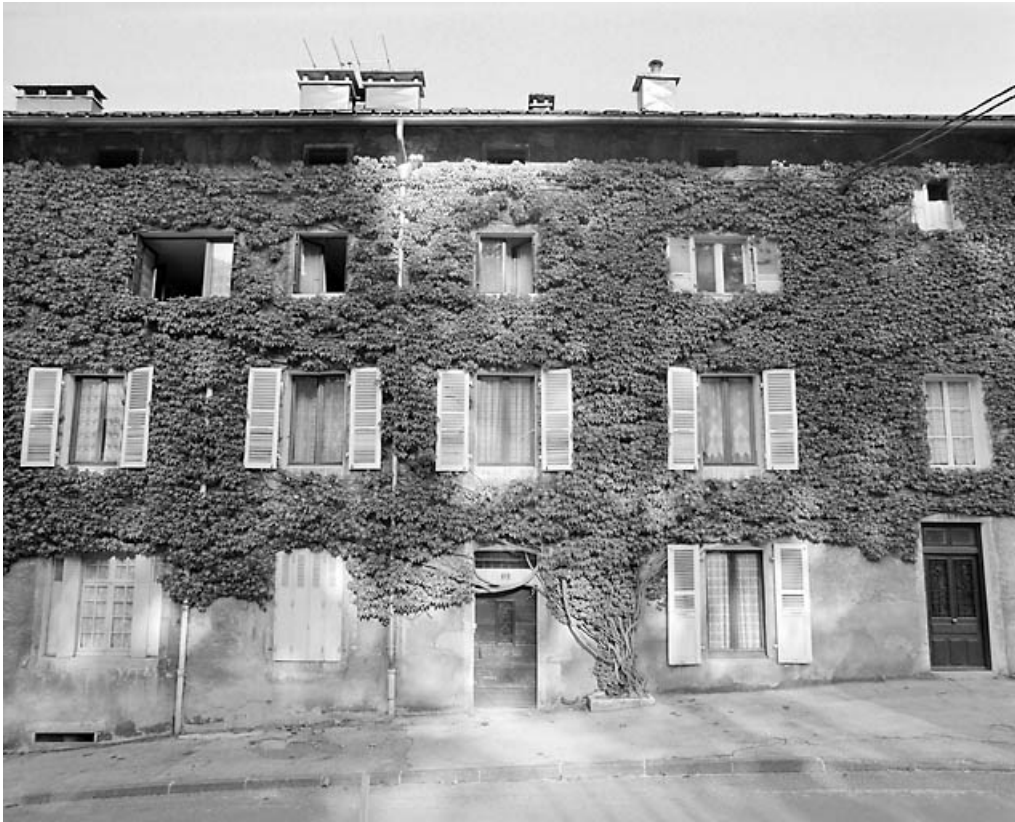
Bâtiment 11-15 rue Pasteur : façade antérieure au niveau des n° 11 et 13. 39, Morez, 7-15 rue Pasteur