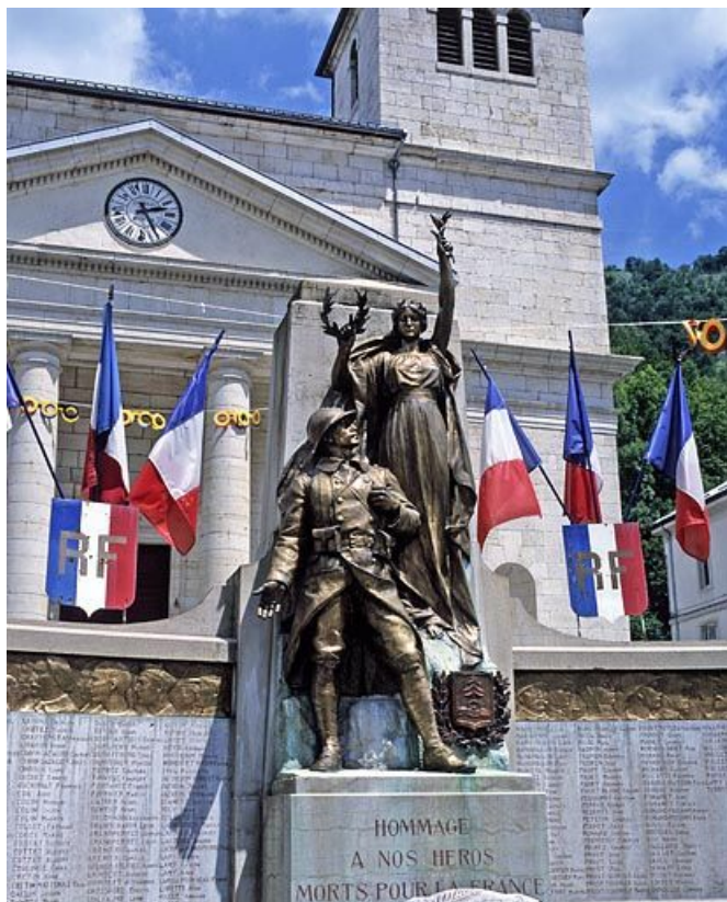
Groupe sculpté : vue d'ensemble.