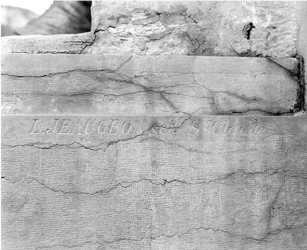
Socle : signature du sculpteur Jeaugeon.