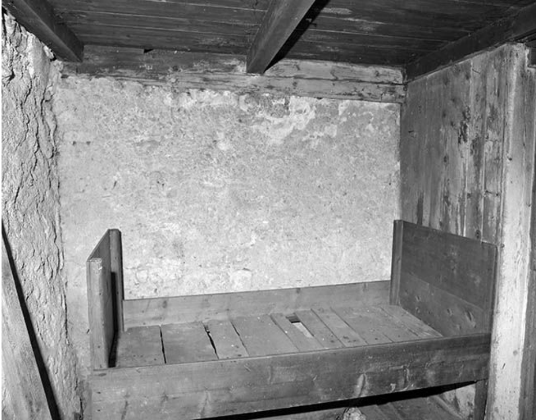
Le lit en alcôve de la pièce de séjour.

39, Bois-d'Amont, lieudit : Plan de la Fruitière