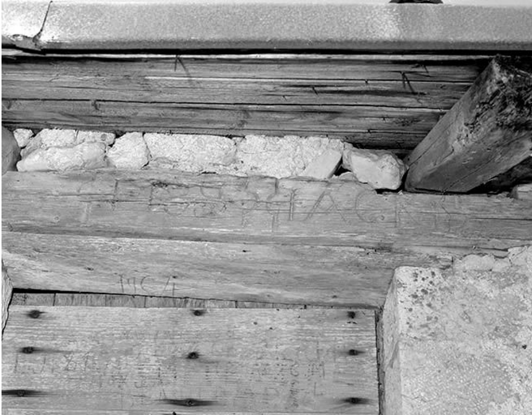
Date portée sur le linteau de la porte d'accès.

39, Bois-d'Amont, lieudit : Plan de la Fruitière