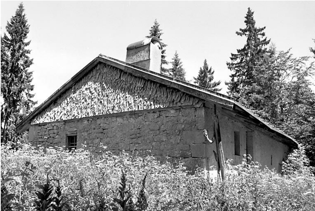
Face gauche et façade antérieure.

39, Bois-d'Amont, lieudit : Plan de la Fruitière