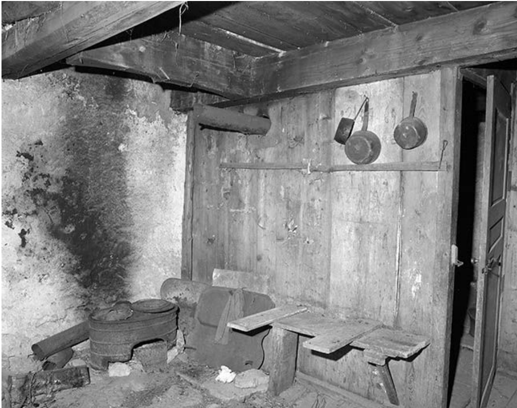
La cuisine : emplacement de la cuisinière. 39, Bois-d'Amont, lieudit : Plan de la Fruitière