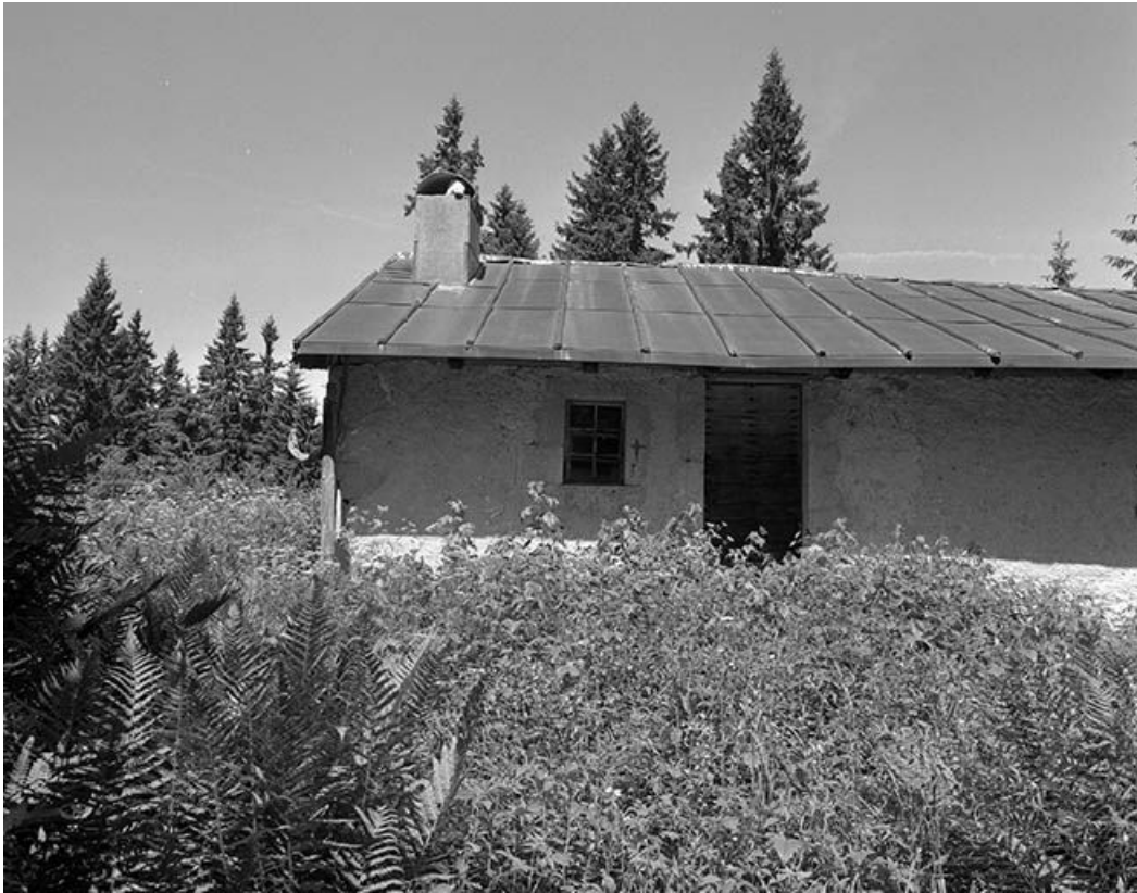
Porte d'accès de la façade antérieure.

39, Bois-d'Amont, lieudit : Plan de la Fruitière