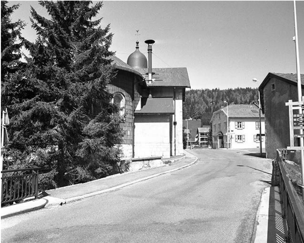
Vue de l'église depuis le pont sur l'Orbe.