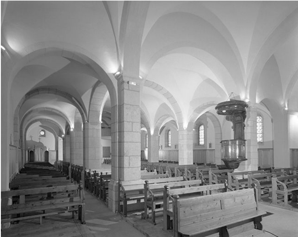
Le chœur vu depuis la nef.