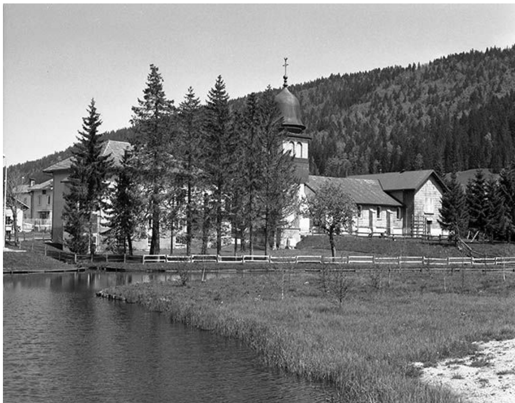
Vue éloignée de l'église.