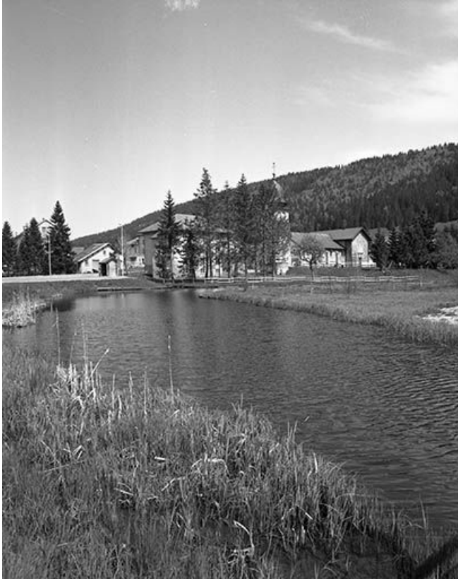
Vue éloignée de l'église (vue verticale).