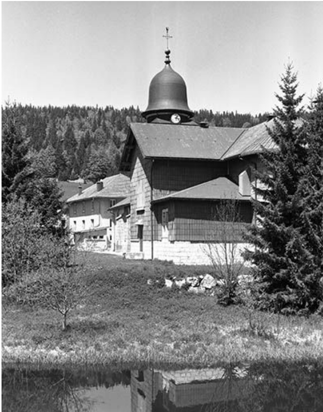
Vue de l'église depuis le sud.