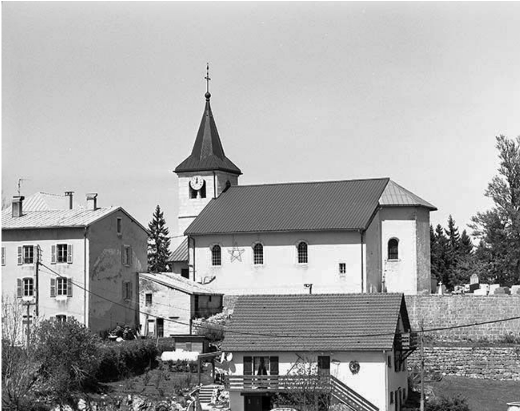
Vue éloignée de la façade latérale droite.