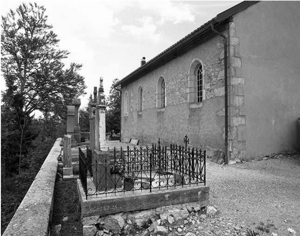
Façade gauche vue de trois quarts.