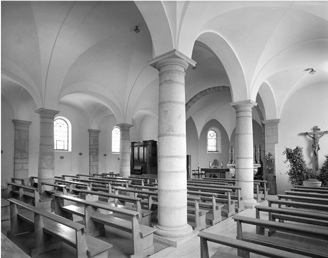
Vue intérieure du vaisseau central, de trois quarts.