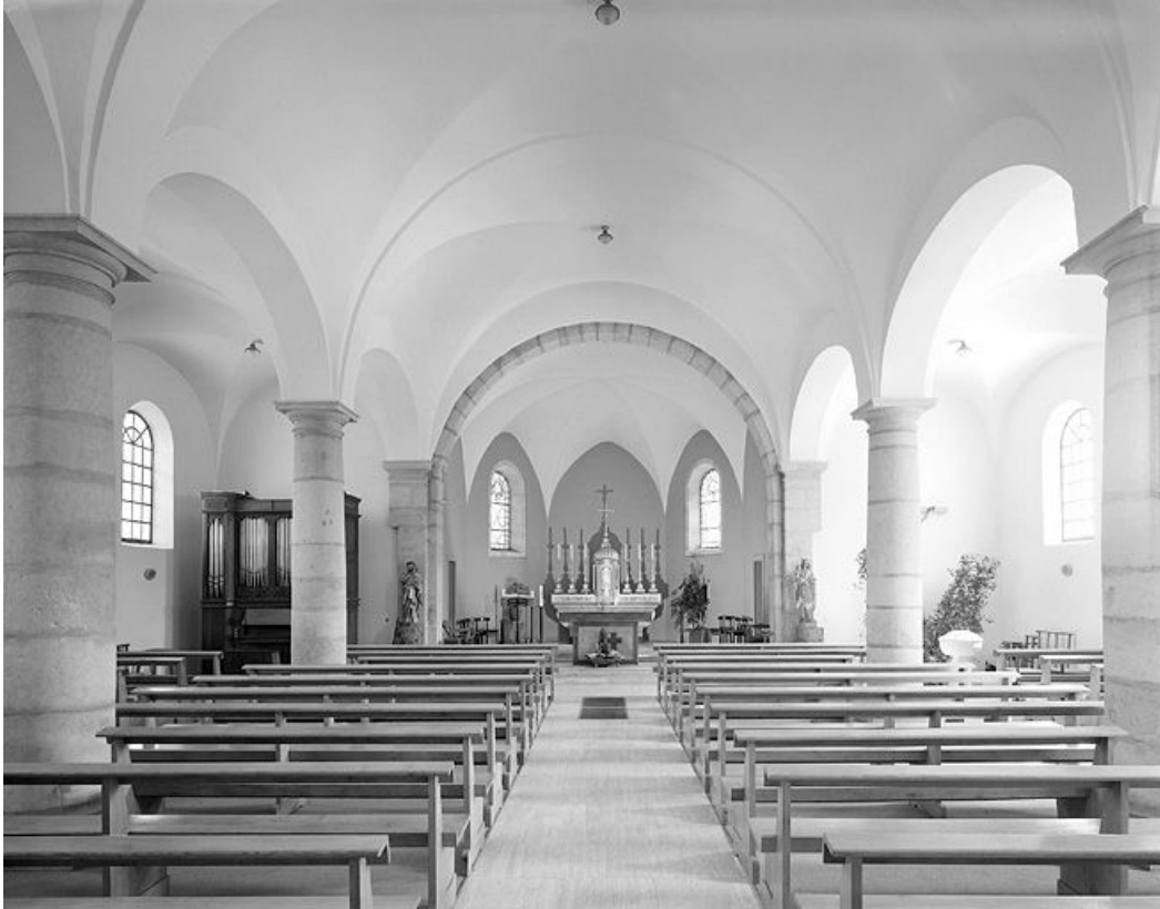
Le vaisseau central vu depuis l'entrée.