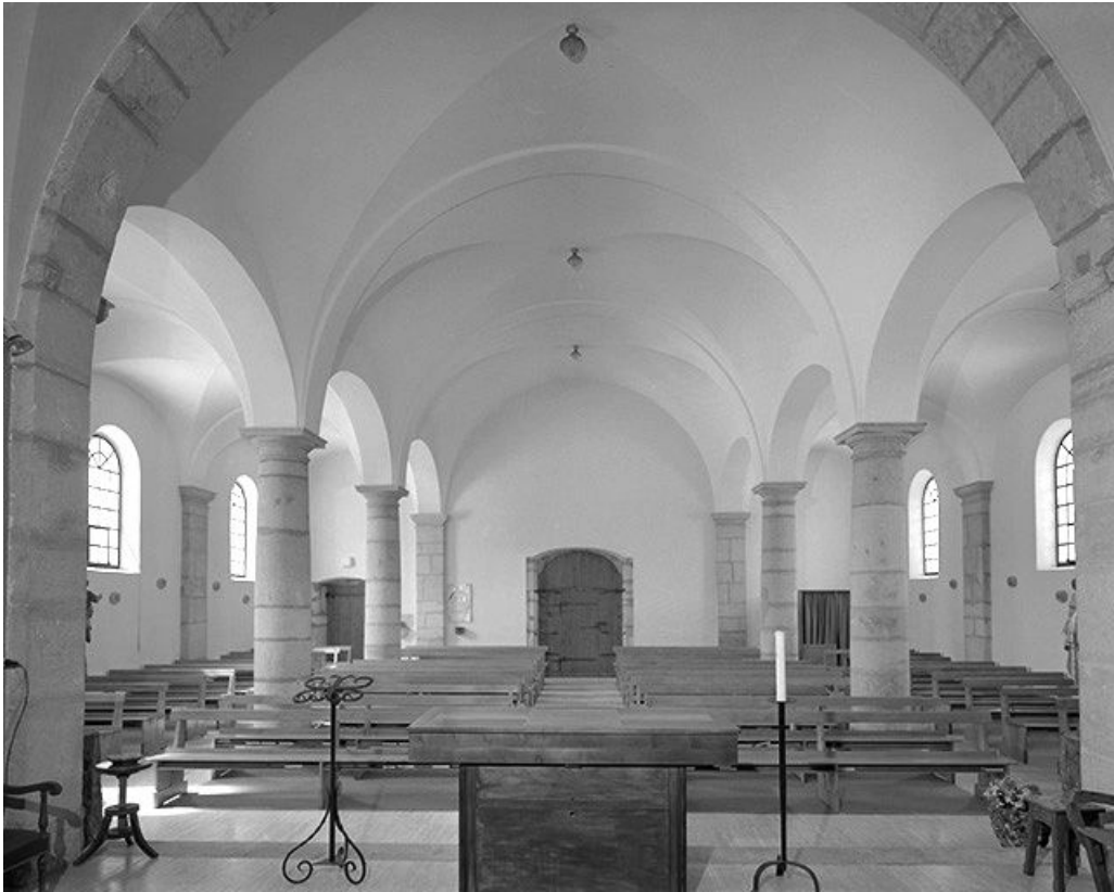
Le vaisseau central vu depuis le chœur.