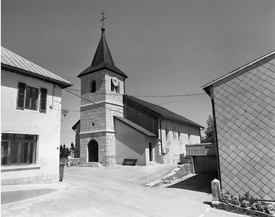
Façade antérieure vue de trois quarts droit.