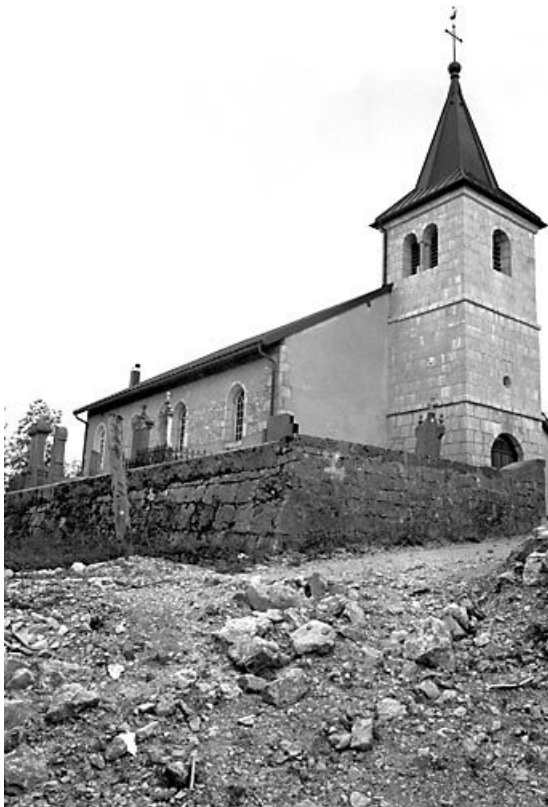
Façade antérieure et face gauche vues de trois quarts.