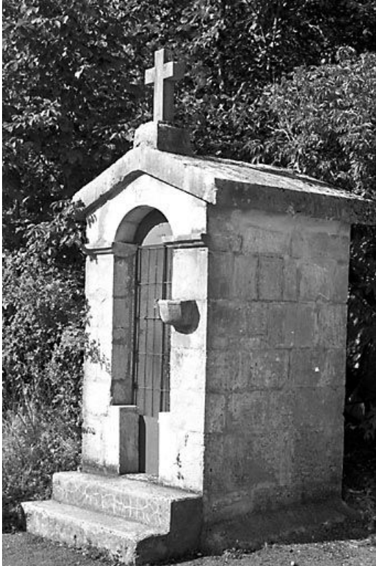
Façade antérieure vue de trois quarts droit.

39, Morbier impasse de l' Oratoire, lieudit : la Combe froide