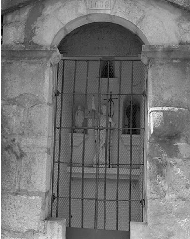
Porte d'accès à l'autel, grille.

39, Morbier impasse de l' Oratoire, lieudit : la Combe froide