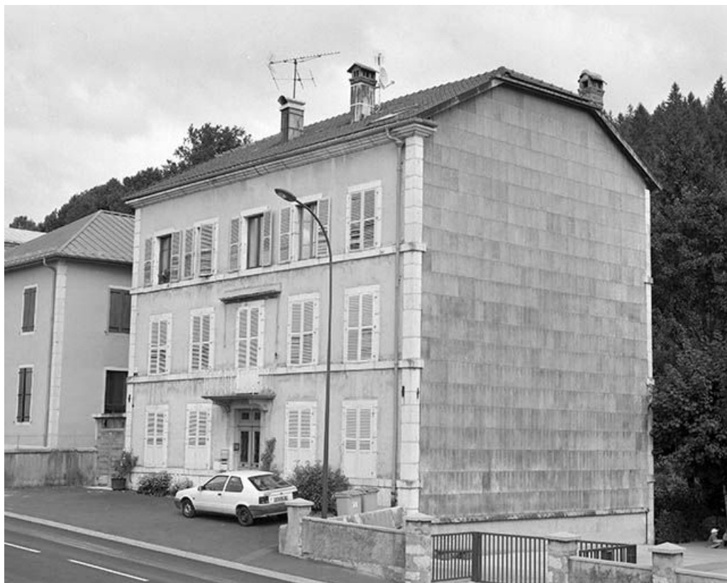
Façade antérieure et face droite vues de trois quarts.