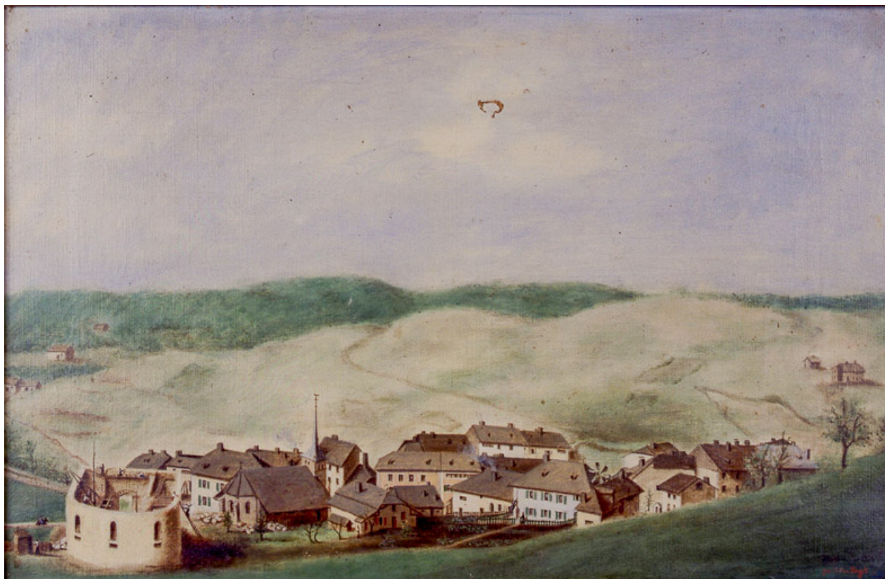
Morbier en 1835, l'église en construction.