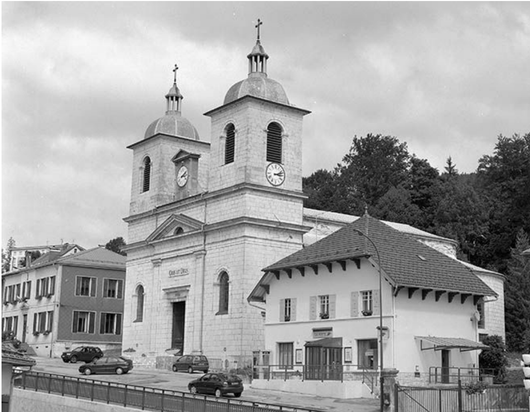
Façade antérieure vue de trois quarts droit.