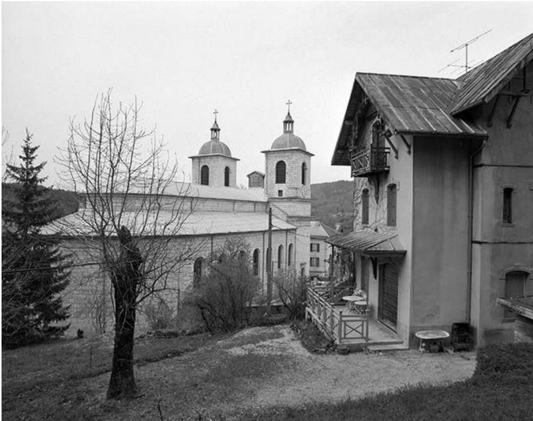
L'abside et la face gauche.