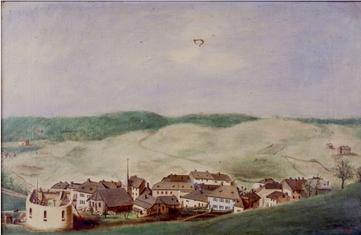
Morbier en 1835, l'église en construction.