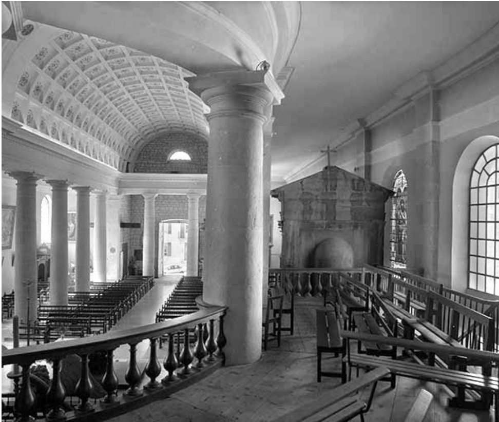
Le vaisseau central vu de trois quarts depuis le déambulatoire.