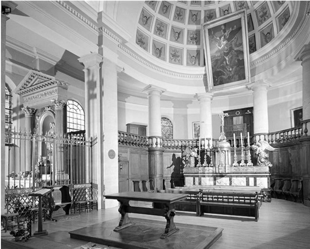
Le chœur et le déambulatoire.