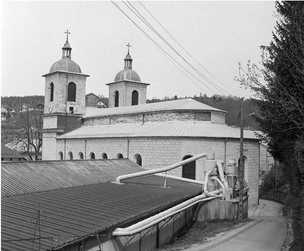
L'abside et la face droite.