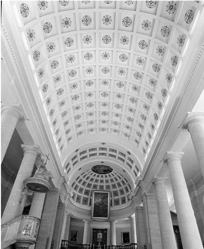
La fausse voûte en plein cintre du vaisseau central.