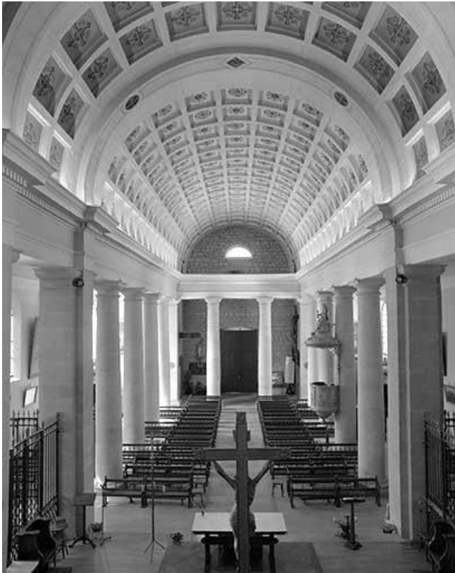
Le vaisseau central vu depuis le déambulatoire.