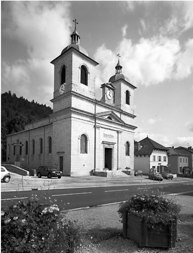
Façade antérieure vue de trois quarts gauche.