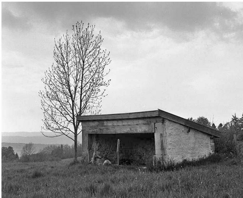
Appentis abritant un abreuvoir à proximité de la ferme.