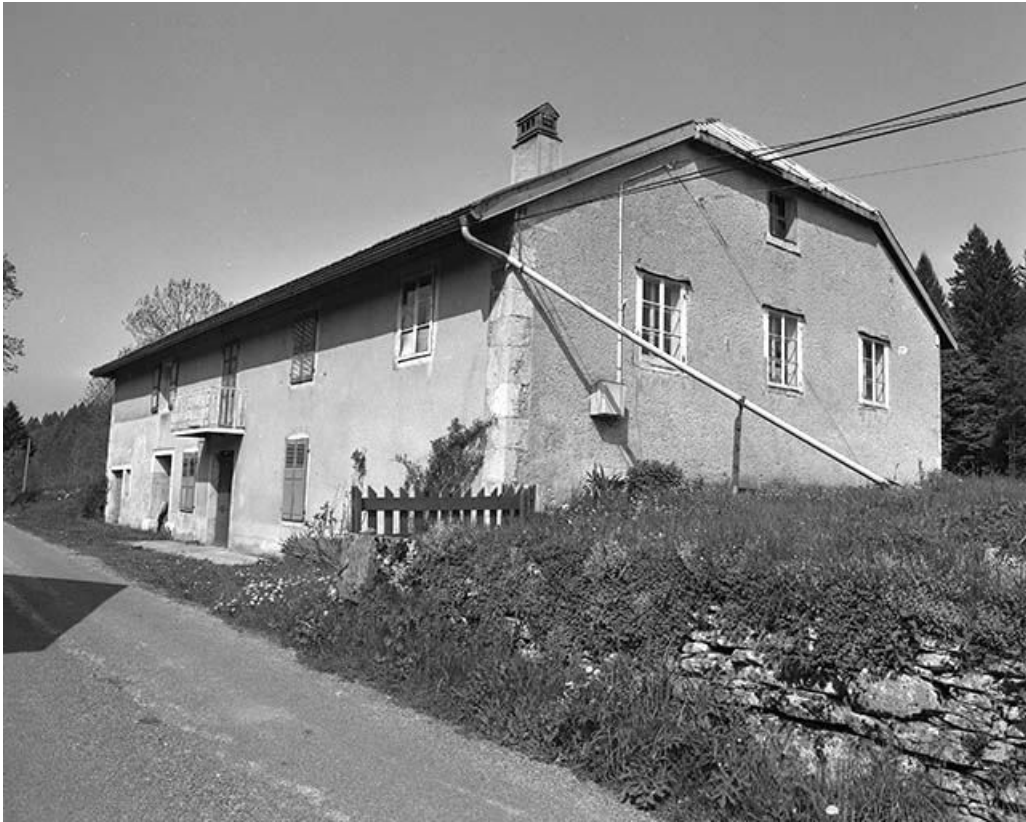
Façade antérieure et face droite.

39, Longchaumois, lieudit : les Repentys