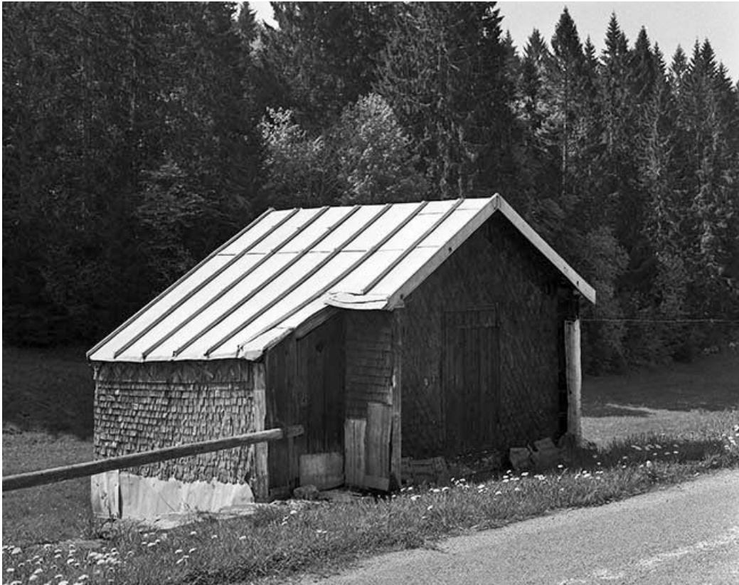
Resserre, appelée " grenier fort ".

39, Longchaumois, lieudit : les Repentys