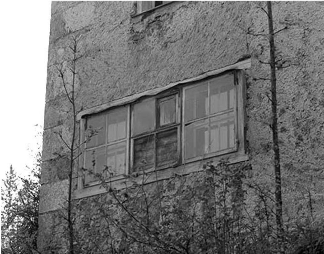
Fenêtre triple sur la façade postérieure.

39, Longchaumois, lieudit : les Repentys