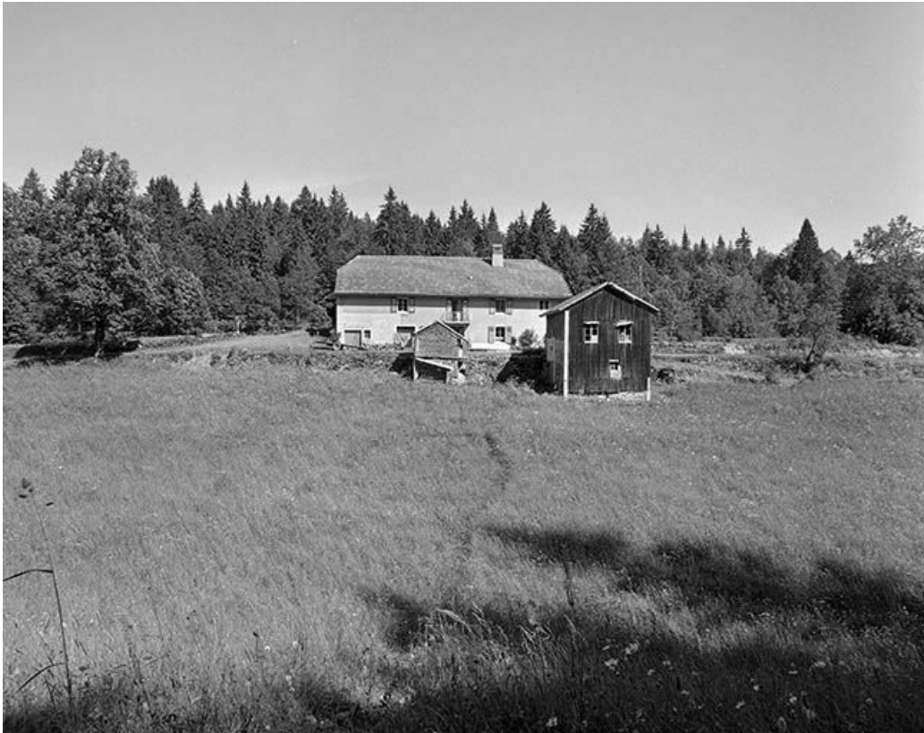
Façade antérieure, vue éloignée.