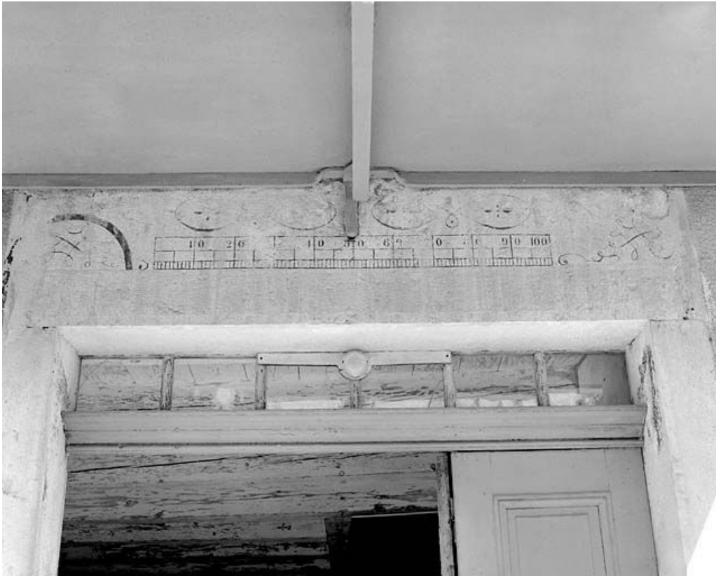
La décoration portée sur le linteau de la porte d'accès.

39, Longchaumois, lieudit : les Repentys