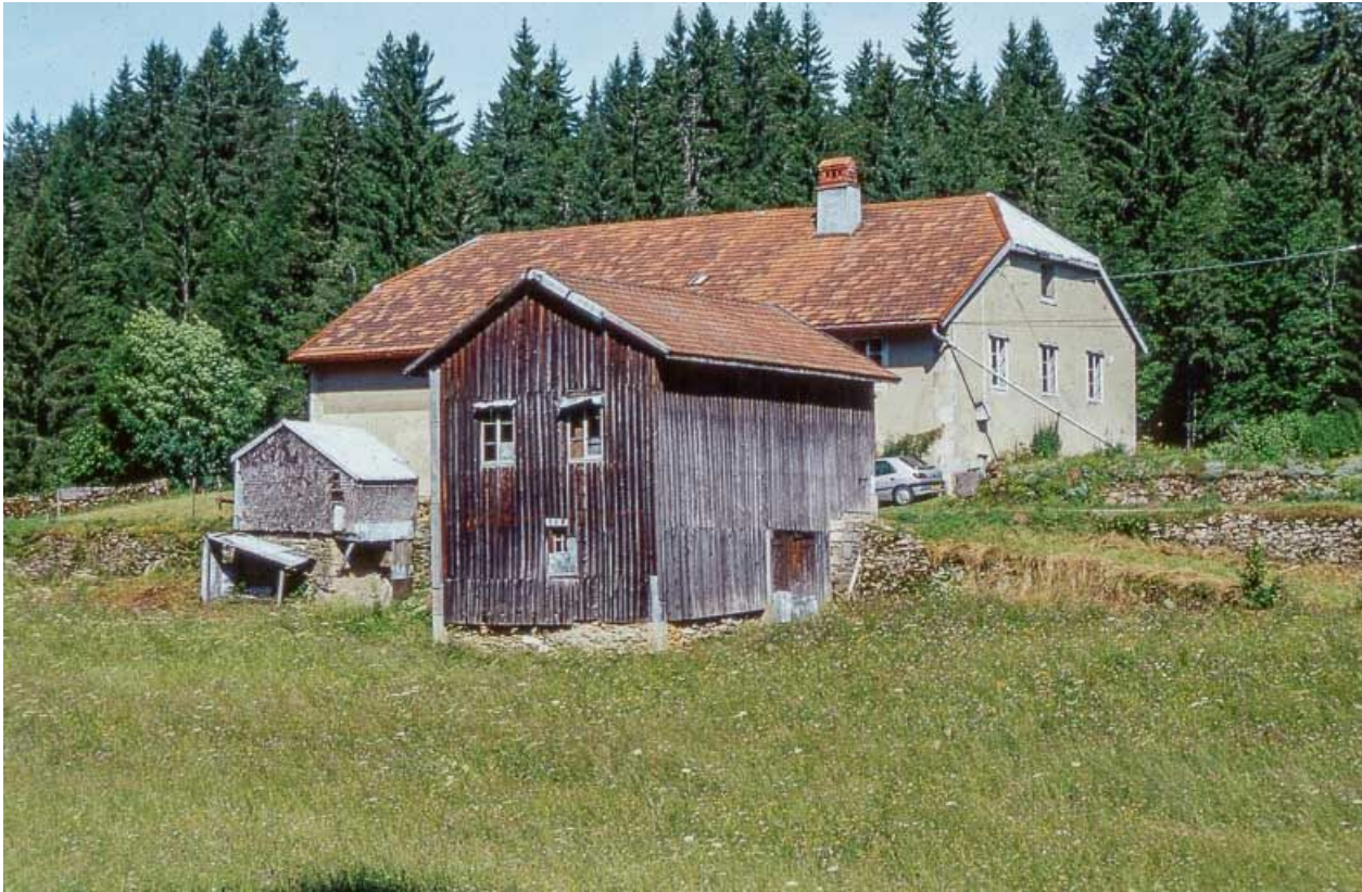
Vue d'ensemble de la ferme, de la remise et du " grenier fort ".

39, Longchaumois, lieudit : les Repentys