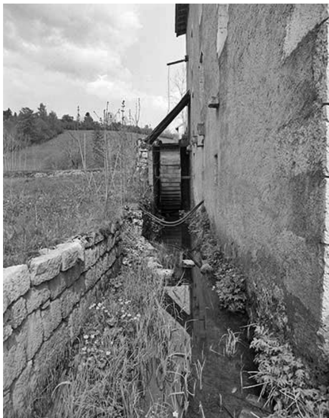
Vue sur la roue à aubes et le canal de fuite.

39, Longchaumois, lieudit : les Moulins Piquands