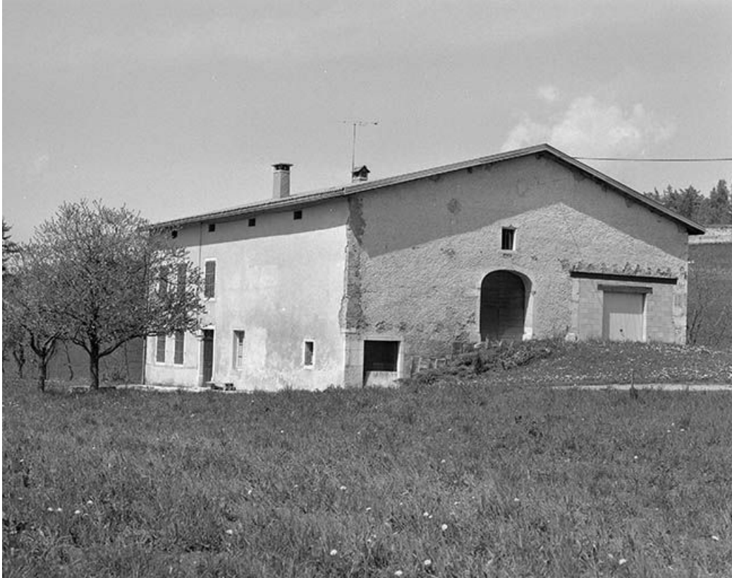
Vue de trois quarts de la façade postérieure et de la face droite.

39, Longchaumois, lieudit : les Moulins Piquands