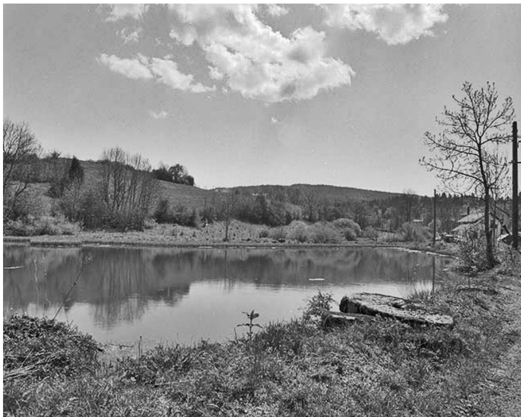
Bassin de retenue d'eau, au premier plan, une meule de l'ancien moulin.

39, Longchaumois, lieudit : les Moulins Piquands