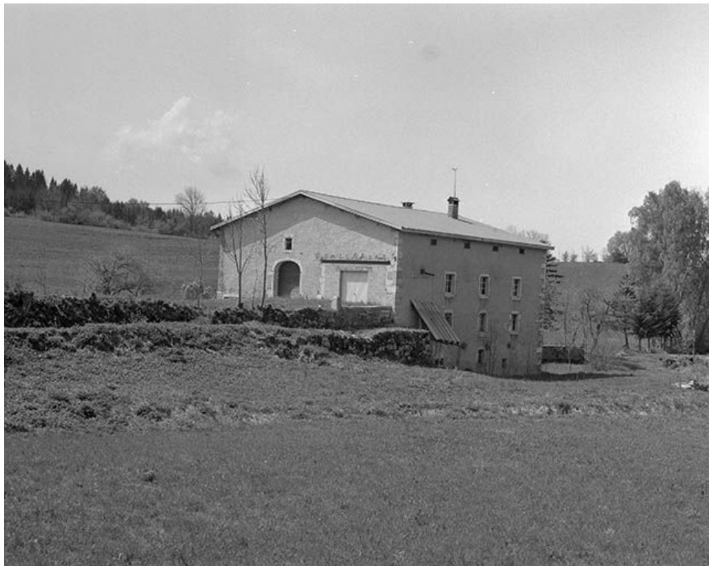
Vue de trois quarts de la façade postérieure et de la face droite.

39, Longchaumois, lieudit : les Moulins Piquands