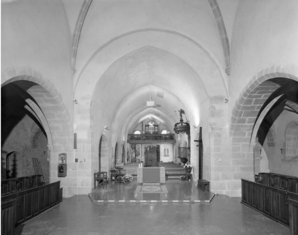
La nef vue depuis le chœur.